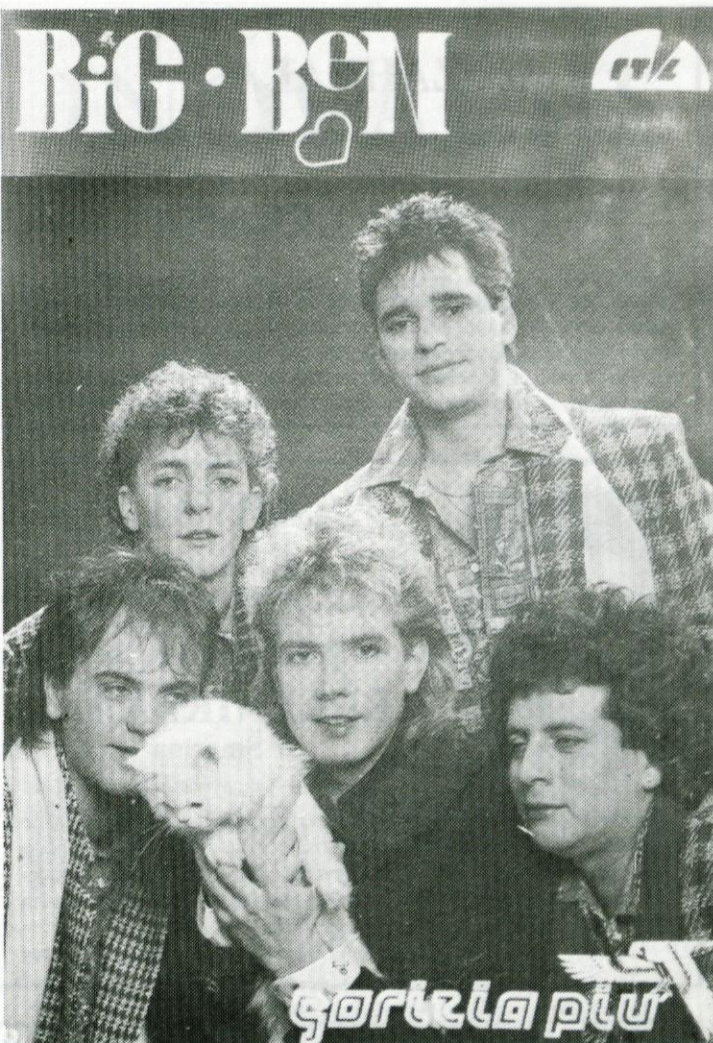
Muca Caty, maskota skupine Big Ben.