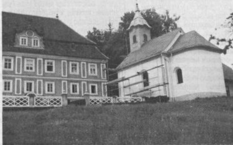
Cerkev sv. Florjana v Šeneku so popolnoma obnovili

Prihodnji teden, v sredo, bo ob 16. uri v osnovni šoli računalniška raziskovalnica, v soboto ves dan bo dan odprtih vrat Prostovoljnega gasilskega društva Polzela, ob 10. uri pa blagoslovitev obnovljene cerkve sv. Florjana v Šeneku. Za nedeljo, 13. oktobra, pa pripravljajo srečanje ostarelih in bolnih v župnijski cerkvi. Ves ta in prihodnji teden se bo zvrstilo tudi več športnih prireditev.. ■ -er