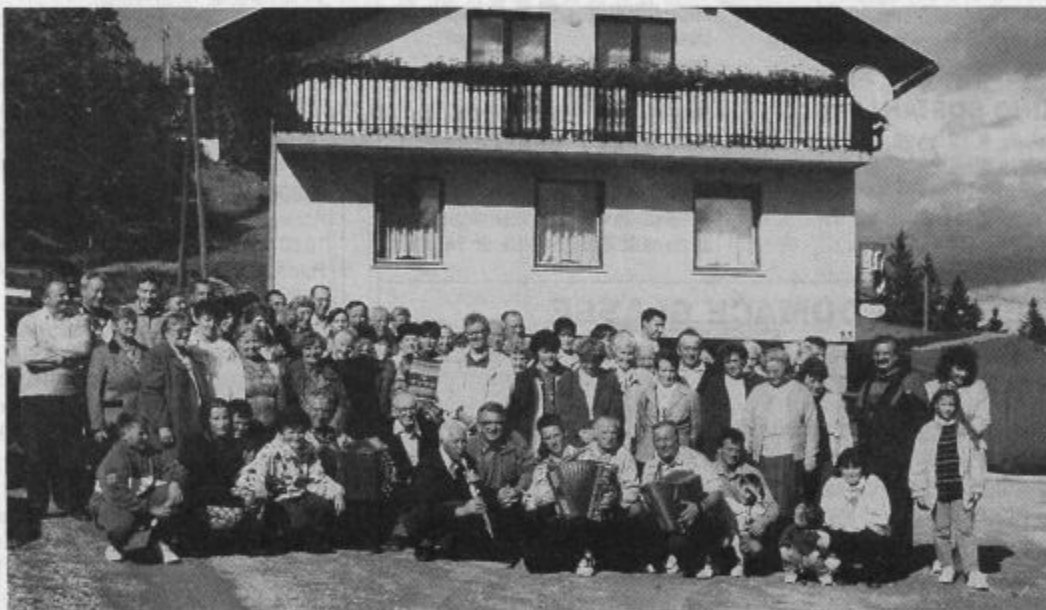
Člani rodbine Knez - Pečolar - Lorenci na 20. jubilejnem srečanju

Tudi srečanja rodbine Knez - Pečolar - Lorenci so postala tradicionalna, saj so se letos septembra zbrali že dvajsetič. V znani gostilni "Pri Pečolarju" v Razborju pri Slovenj Gradcu se je tokrat srečalo okoli 120 sorodnikov, ki so sem prišli domala iz cele Slovenije, največ pa jih je seveda bilo iz Šaleške, Mislinjske in Mežiške doline. Mnogim znanim, se vsako leto pridruži kakšen neznan obraz, in šele podroben pogovor pojasni novo sorodstveno in rodbinsko povezavo. Rodbina, ki svoje korenine vleče iz doline Bistre na Koroškem in iz Razborja (torej štajersko - koroška kombinacija), se vedno sreča nekje v bližini Uršlje gore ali Pece, največkrat pa so ta srečanja bila pri "Pečolarju" v Razborju, kjer živi tudi največ rodbinskih članov. Tudi po tokratnem zelo prijetnem druženju, so si obljubili, da se prihodnje leto spet srečajo. ■ Damijan Kljajič