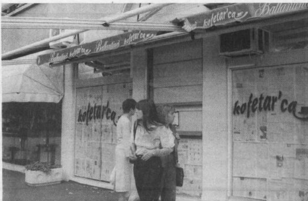
Pred zaprto Kofetar'co se ustavljajo mimoidoči in z zanimanjem prebirajo vsebino sporočila.