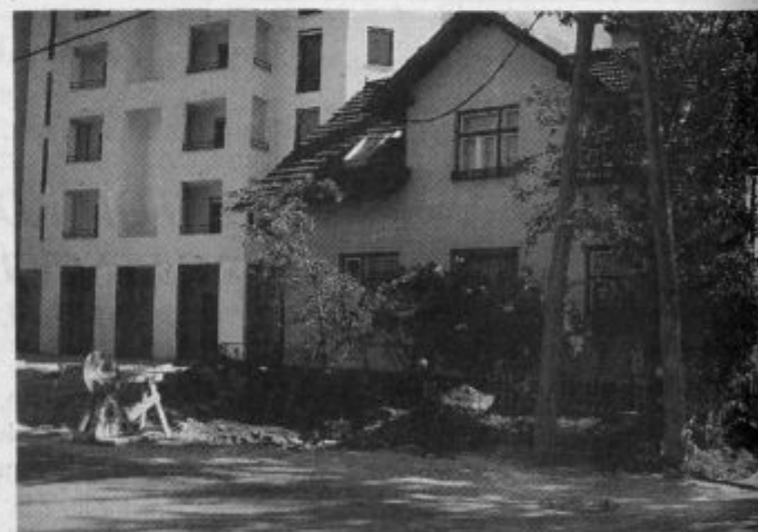
Stara Zagradišnikova domačija bo kmalu obstajala le še na fotografijah.

Predaje ključev so se udeležili vsi predstavniki tistih, ki so Zagradišnikovim zgradili in financirali nov dom.