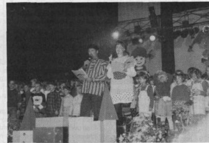
In prišel je čas za slovo, vendar le za leto dni

janski otroci. Zaključena je bila res uspešna akcija Novo sonce, iz polic pod tem napisom so nas pozdravljale številne igračke, ki bodo sonce prinesle v srca sarajevskih otrok. Številni nastopajoči so naredili slovo še bolj slavnostno, potem pa se je od otrok poslovila še Pika. In seveda obljubila, da prihodnje leto spet pride. Za kar bosta zagotovo ponovno poskrbela Kulturni center Ivana Napotnika in Medobčinska zveza prijateljev mladine Velenje. Letos jim je pomagal tudi Unicef.