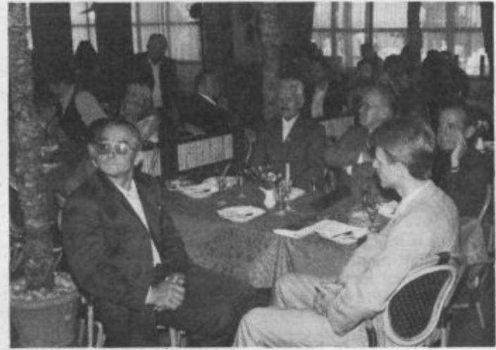
V restavraciji Jezero je bilo slovesno, ribiči so slavili pol stoletni jubilej.