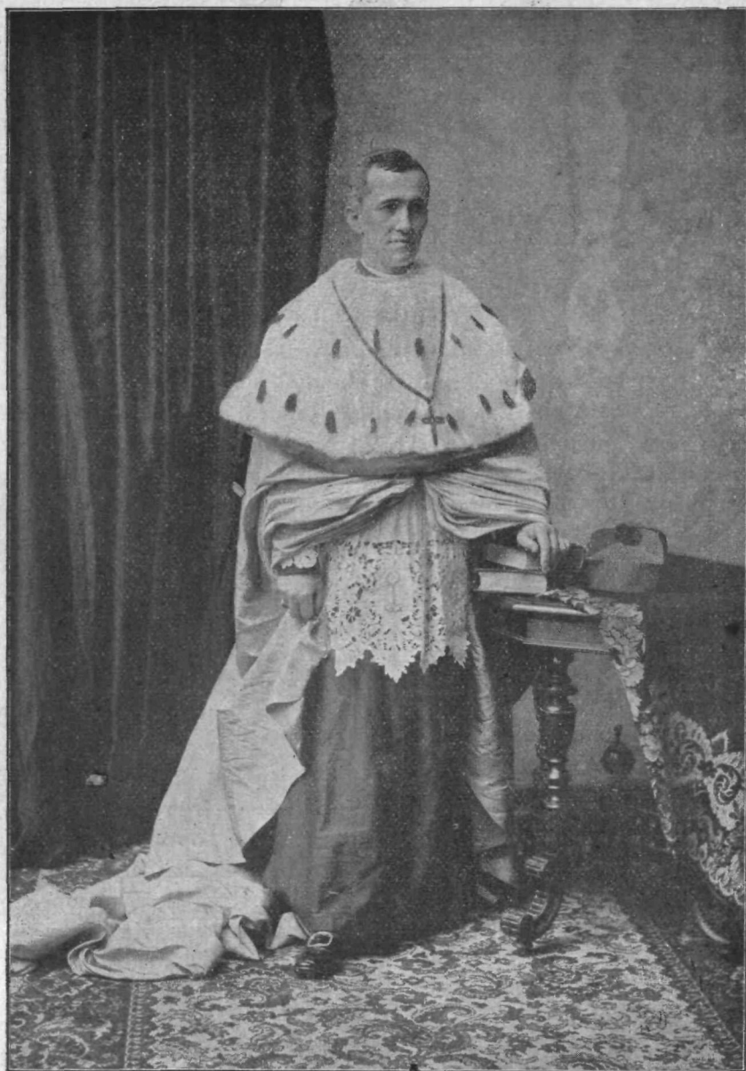
Véliki ljubitelj slovenske mladine, dr. Anton Bonaventura Jeglič, dvajset let knezoškof ljubljanski.