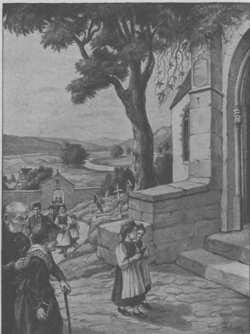
Pot v cerkev.