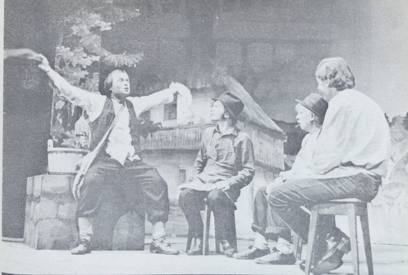
„DIVJI LOVEC“ V SLOVENSKI HIŠI

Slovensko gledališče Buenos Aires je v soboto, 23. aprila v oveh predstavah ter v nedeljo, 24. aprila, napolnilo dvorano Slovenske hiše z uprizoritvijo Finžgarjevega „Divjega lovca“ v priredbi in režiji Maksa Borštnika.