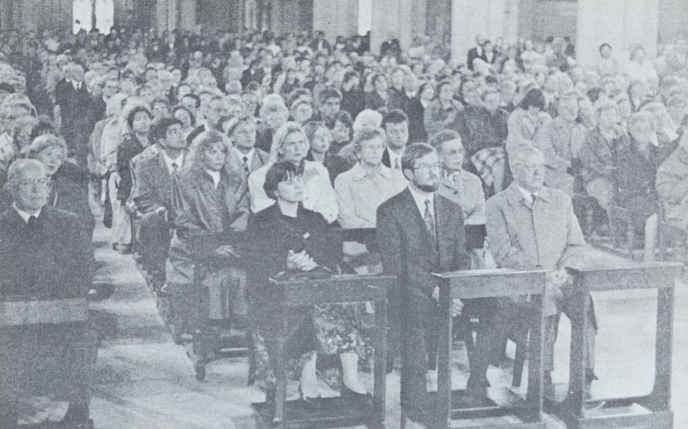
Blagoslov z Najsvetejšim po petih litanijah na letošnjem romanju v Luján.