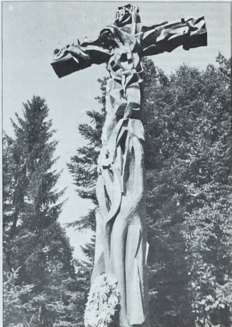
Pomnik pod Krenom v Kočevskem Rogu

Mrtvaška ura niha čas: Ne bo ga več, ne bo med nas.