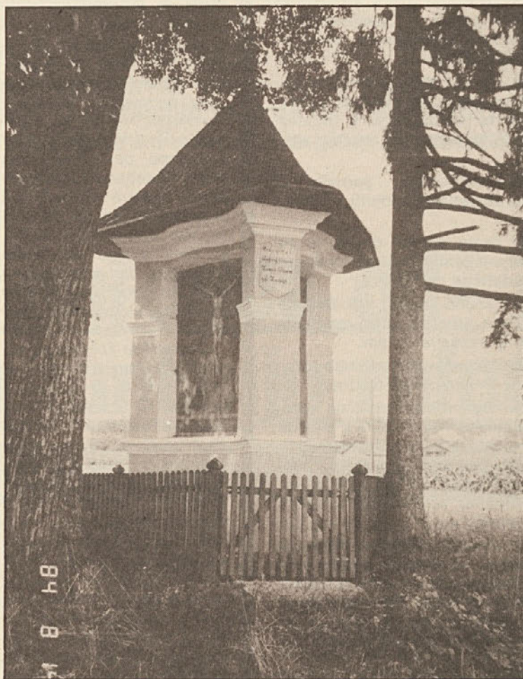
Zgledno obnovljeno Tomanovo znamenje pri Svinči vasi.

d) Iz vsega lahko sklepamo, da so verska — in mutatis mutandis — cerkvena vprašanja — ravno zaradi določenih nadvse obetajočih duhovnih premikov — važnejša za narodnopolitična razglabljanja kot včasih, ko smo kot manjšina živeli v zaokroženem katoliškem svetu. Zato se mora čim več ustanov ukvarjati s tem problemom in ga ne prepuščati le internim oddelkom Cerkve. V katoliških vrstah je ravno tako že lepo število zaveznikov v boju za pravičnejšo družbo in dejansko enakopravno, t. j. popolnoma nesporno upoštevanje slovenskega jezi-