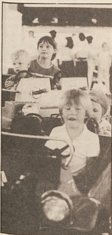
Otroci so imeli svoje vesele na zabavišču.

Petstoenaidevetdeseti pliberški jormak se je ponedeljek ponoči iztekel. Pravih viškov na največjem ljudskem slavlju južne Koroške pravzaprav ni bilo. Od sobote do ponedeljka je pripekalo poznopoletno sonce na sejmišče, kjer so bili šotori polni žejnih obiskovalcev. Kromarji in trgovci so bili ob takem odličnem vremenu s svojim izkupičkom seveda zelo zadovoljni. Tudi do večjih nezdod letos ni prišlo, rdeči križ je preživel miren jormak.