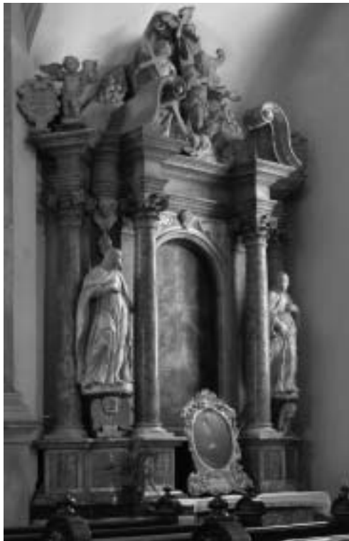
2. Oltar sv. Ignacija Lojolskega. Ljubljana, župnijska cerkev sv. Jakoba.