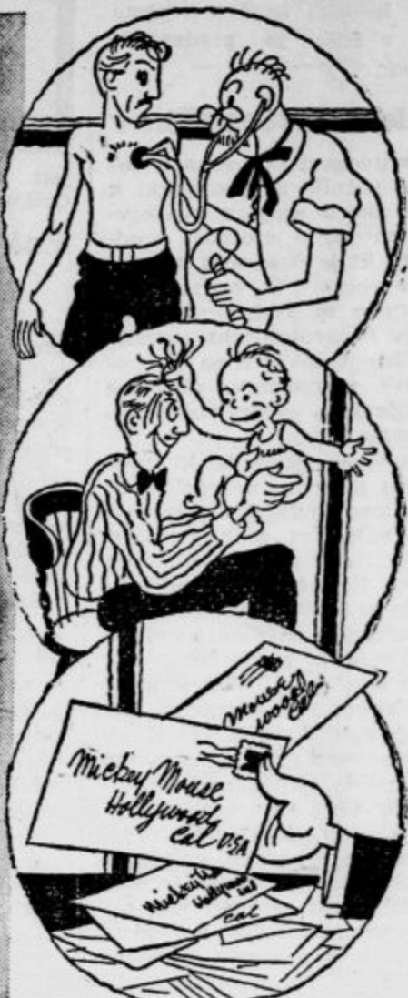
Walt Disney, tvorec slovitih risanih filmov z malo junakinjo miško Miki, je zaslužil že milijone, in jih še bo ...