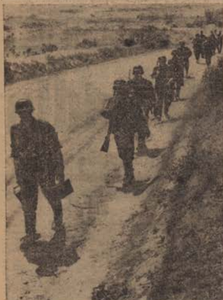
Von der Sewastopolfront.

V noči na pretekli četrtek so pa dale nemške bombe na industrijsko področje angleškega mesta Birmingham ter na vojno važne cilje v Jugovzhodni Angliji.