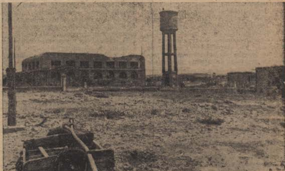
PK-Kriegsbericht Zwillig (Sch)

Od strani vseh kmetijsko pospeševal-nih oblastev se pospešuje pridelovanje oljnate ogrščice (der Raps) in oljnate repice (der Rübsen), o katerih je naš list že lani pisal. Že takrat smo ome-nili, da imata obe rastlini po tri zvrsti: ozimno, jaro in poletno ali strniščno zvrst. Za strniščno setev pridejo v poštev le strniščne zvrsti in je treba pri nakupu semena tozadevno dobro paziti, kajti z nepravim semenom nam ni nič pomagano.