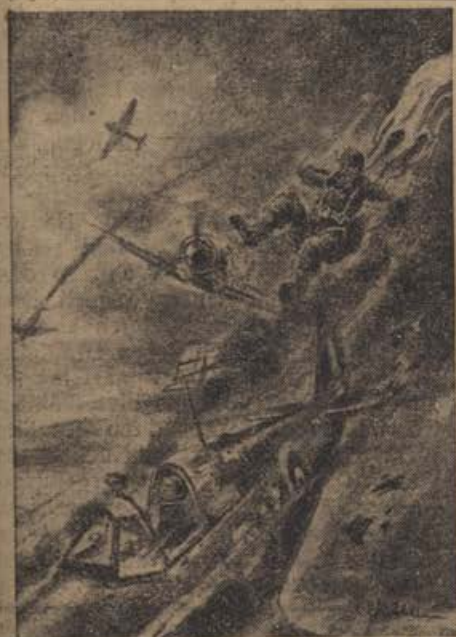
PK-Zeichnung Möller (Sch)