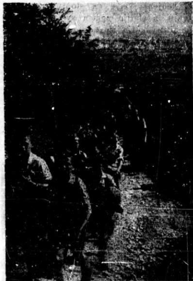
Izlet na Smarjetno goro.

Seveda, o tem lepem kosu zemlje so jim že mogoče pravili očetje, o tej lepi deželi pod Triglavom, ki je obkrožajo gore kakor okamenela pravljica, o deželi, kjer spomladi klokoče rumena pomladna voda z gora in kjer pastirji ob živini piskajo kakor jim poje srce, kjer poleti zemlja trepeče od vročine in jim zima tuli ledene podoknice. Tu na tej steni visi nje-