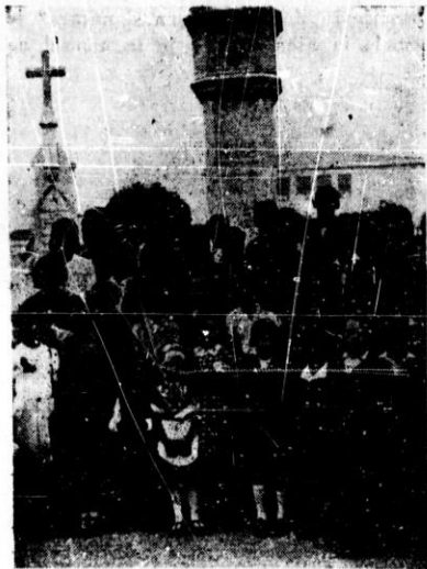
Izseljenčki na Prešernovem grobu.

Vročje avgustovo sonce je lilo z neba vročino na zemljo; dan ni bil iz vrste letošnjih poletnih dni, sonce, samo sonce... „Glej, še narava nam je dobrohotna,“ pravim tovarišu. „Poslala je svoj prostovoljni prispevek naši akciji.“ In