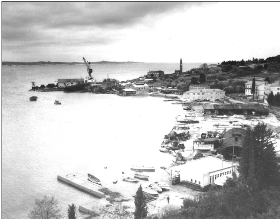
Sl. 1: Piranska ladjedelnica (PAK, 3).