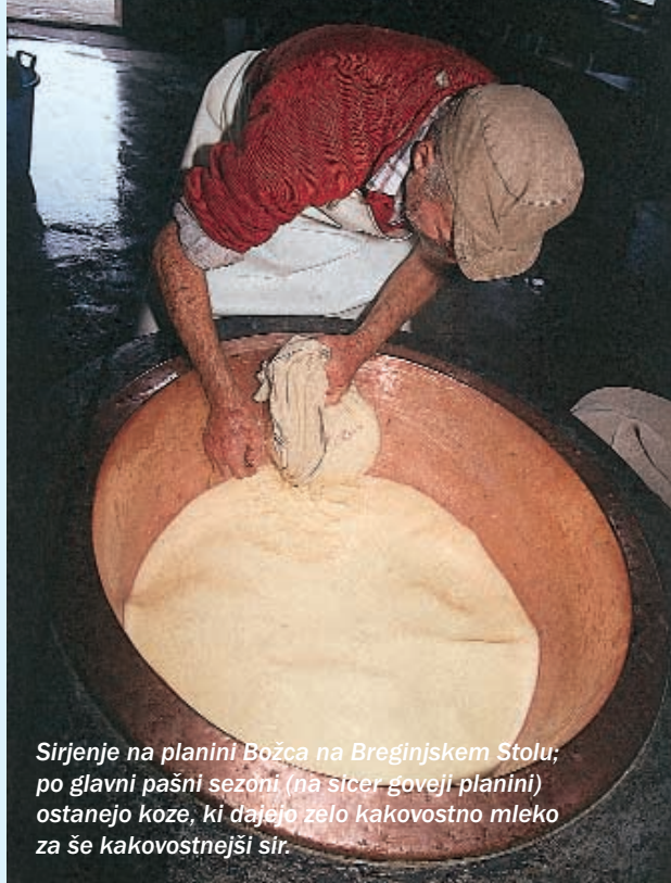
Sirjenje na planini Božca na Breginjskem Stolu; po glavni pašni sezoni (na sicer goveji planini) ostanejo koze, ki dajejo zelo kakovostno mleko za še kakovostnejši sir.

Bohinjske planine so nekaj posebnega. Skoraj do vseh vodijo le pešpoti, tako da so dostopi z živino težavni. V nasprotju s skupno pašo drugih dveh območij se je tu razvilo individualno pašništvo – planšarstvo. Zato je značilna podo-