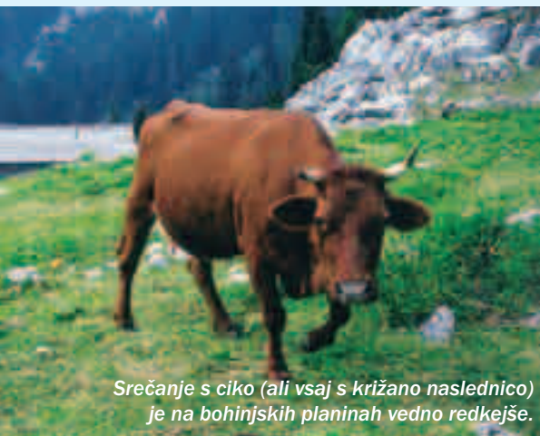
Srečanje s ciko (ali vsaj s križano naslednico) je na bohinjskih planinah vedno redkejše.

Skoraj na vseh planinah stojijo obnovljeni hlevi, sirarna in bivalni prostori. Tudi pašniki so