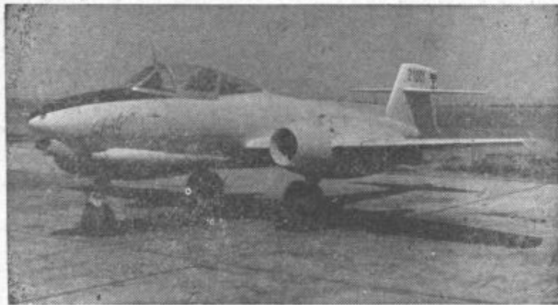
Reaktivno letalo domače konstrukcije

Dedek Mrz za kupuje pri nas raznovrstna novoletna darila