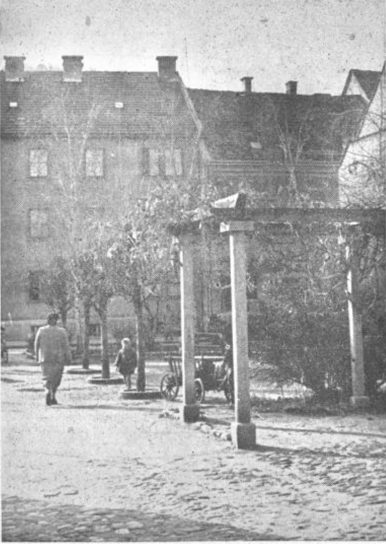
Motiv iz Celja

Objavljeno je bilo poročilo 81 komunističnih partij, ki so tri tedne zasedale neke okoli Moskve. V petih poglavjih je napisana analiza svetovnega položaja: nova etapa kapitalistične krize, napredek SZ, lagerska varnost, združitvev socialističnega internacionalizma in socialističnega patriotizma, vojna nevarnost, ki obstoji, vendar vojna ni usodno neizogibna, demilitarizirani Berlin, mirovna pogodba z Nemčijo, propad kolonializma, med drugim tudi možnost mirnega prehoda v socializem in na koncu, v sistem poglavju še neizogiben šabloniski napad na jugoslovanski revizionizem, ki ga v praksi najbolj brutalno napadata Kitajska in Albanija. T. O.