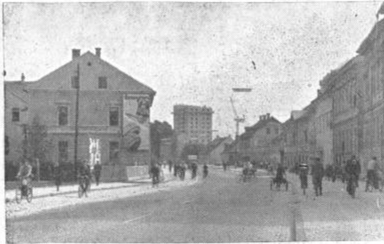
Novi pogled na Gaberje

Zdanes sem radoveden, na kakšna celjska presenečenja bom naletel prihodnjic. Gotovo bo spet kaj všelega v prid mestnemu slovesu.