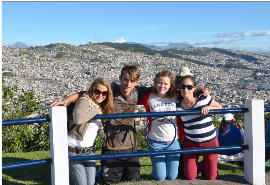
Panecillo (3.000 m), najvišji hrib glavnega mesta Quito; v ozadju južni, revni del dvomilijonskega mesta, čisto zadaj ognjenik Cotopaxi (5.897 m)