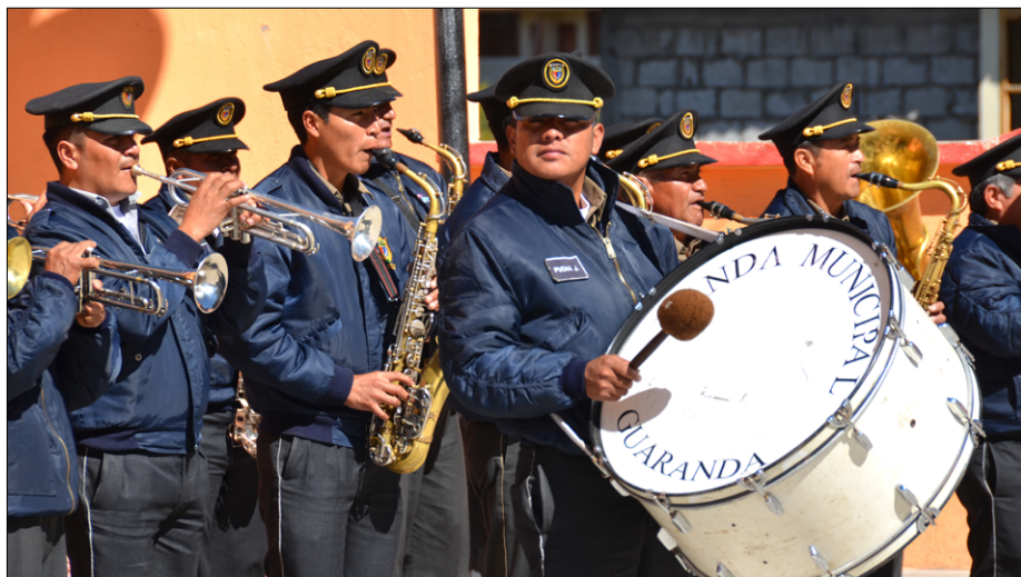
Godba iz Guarnade na praznovanju Dneva narave v Salinasu

Če pomislim, da do letos v Brežicah nismo imeli ločenih kant za smeti in da se nahajamo v krajih, ki nekako predstavljajo naše življenje pred kakšnimi sto leti (z razliko, da tu že imajo mobitele), po tem ne veš več, kako in kaj. Ali pa je samo meni to malo nerazumljivo. Kosilo je bilo skupno. Skromno in preprosto. Vsak je dobil tri kuhane krompirje, še z olupki, nekaj fižolov, še nekaj rdečega, po okusu naše kuhane kolerabe ter sir in meso. Vsa zele-