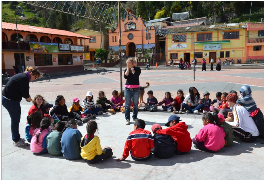
Igre s skupino otrok na trgu v Salinasu