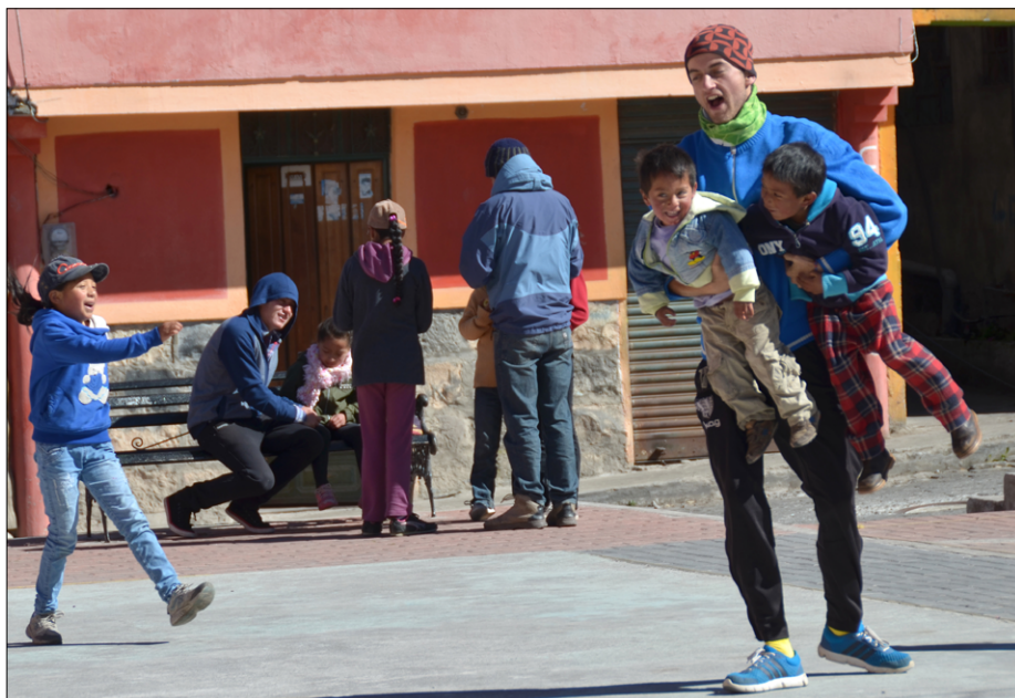
Jutranja zabavna animacija na trgu Salinasu