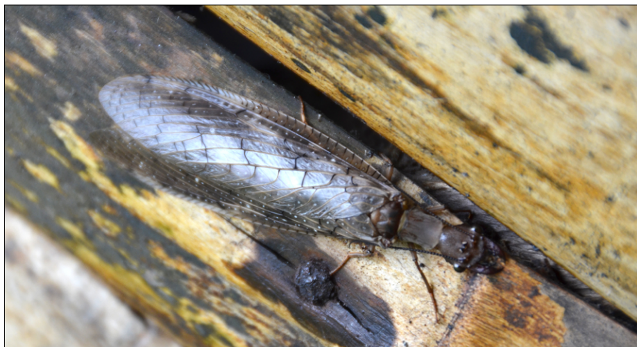
Velikih in nevarnih žuželk v Chazo Juanu ni manjkalo ...