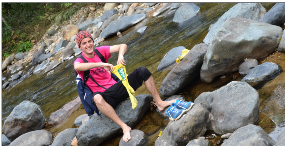
Osvežitev v reki blizu mesta San Luis de Pambil