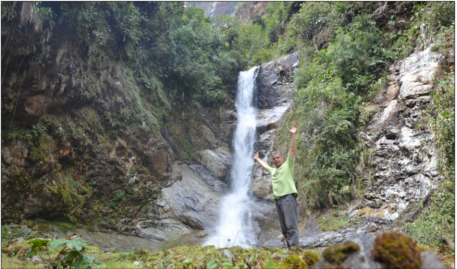
Spodnji slap pod zaraščenimi vršaci, dve uri hoda iz Chazo Juana