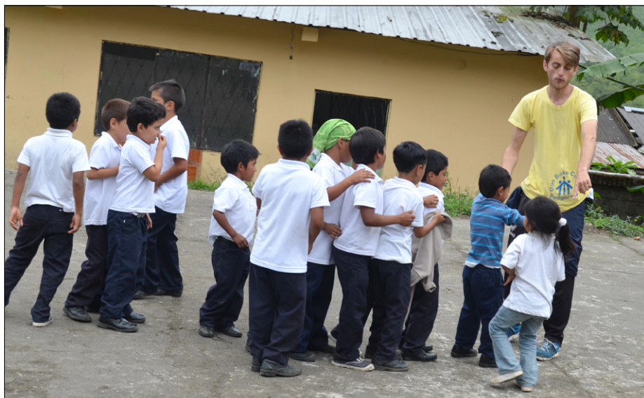
Na šolskem dvorišču v skupnosti Chazo Juan