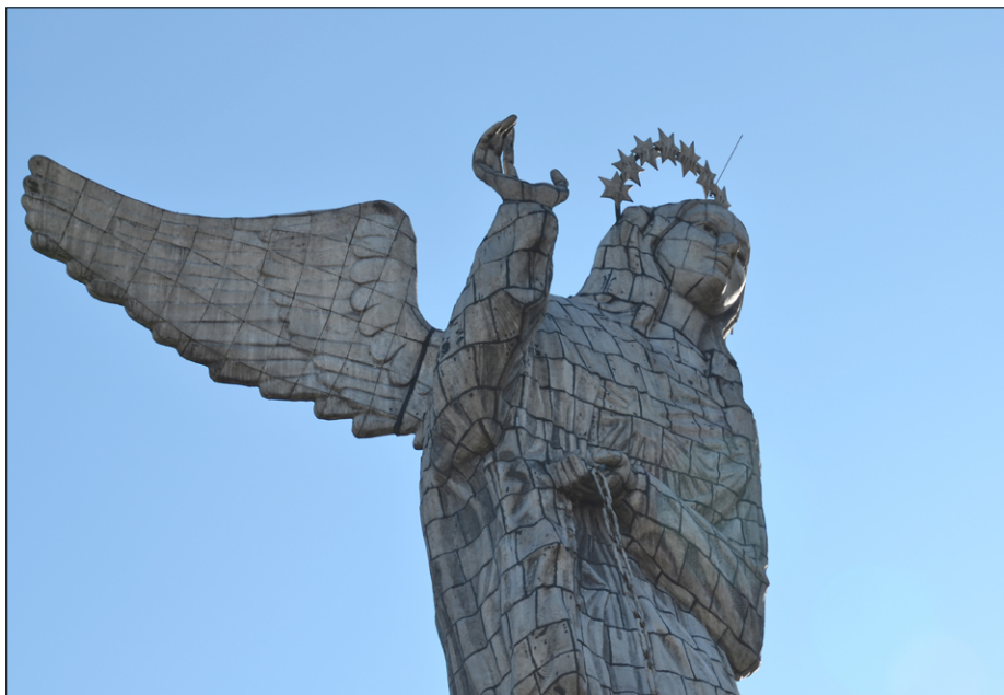
Kip Brezmadežne Device na Panecillu v Quitu