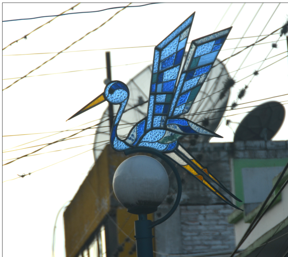
Vitražni okraski ulične razsvetljave v rokodelskem mestu Otavalo