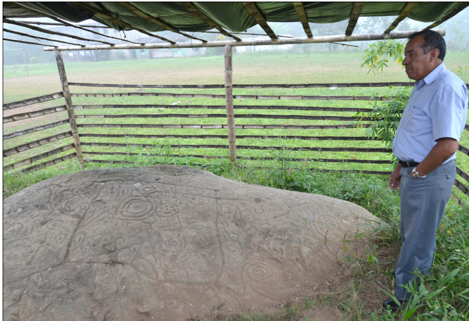
Campo Bello skriva pravo arheološko bogastvo: skala z vklesanimi motivi iz predinkovske dobe (pred 13. stol.)