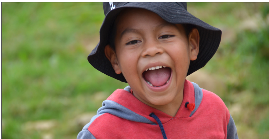
Smeh in veselje otrok je enako po vsem svetu