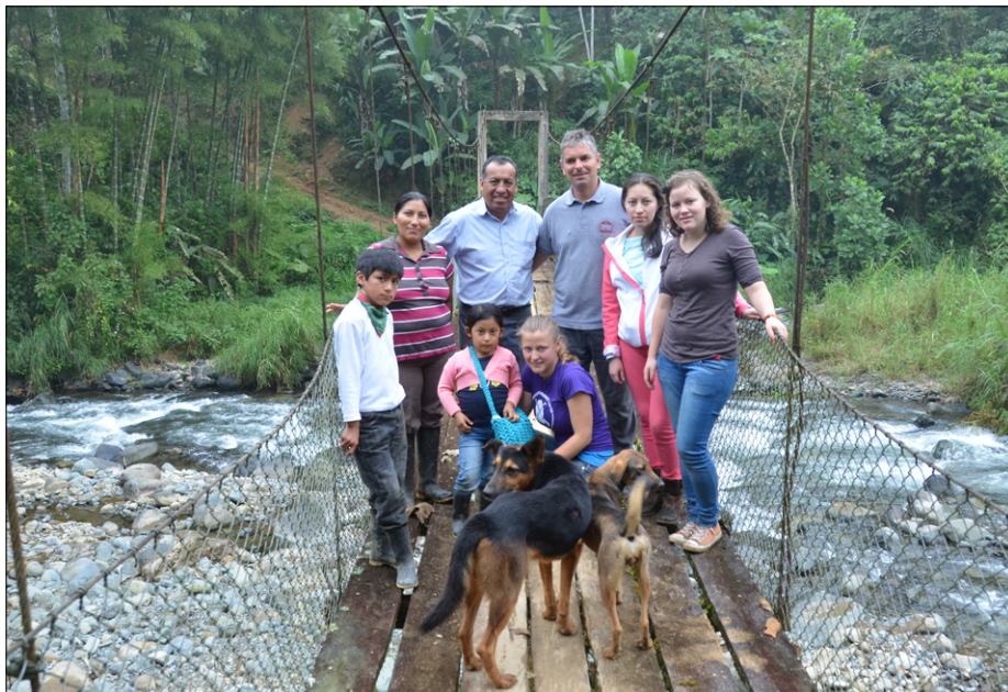
Na mostu ob poti iz skupnosti La Libertad v Campo Bello