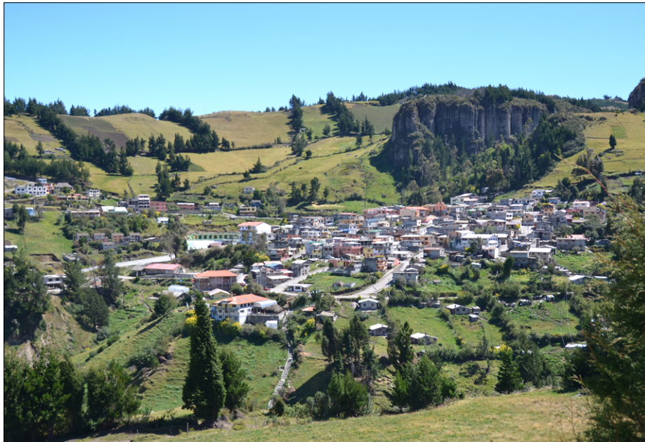
Salinas de Guaranda, tudi Salinas de Bolivar, center misijonskega področja Salinas