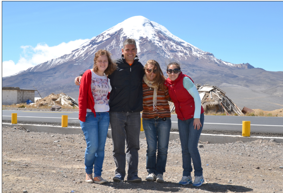
Pod najvišjim ekvadorskim ognjenikom Chimborazo (6.268 m) na poti med Ambatom in Guarando