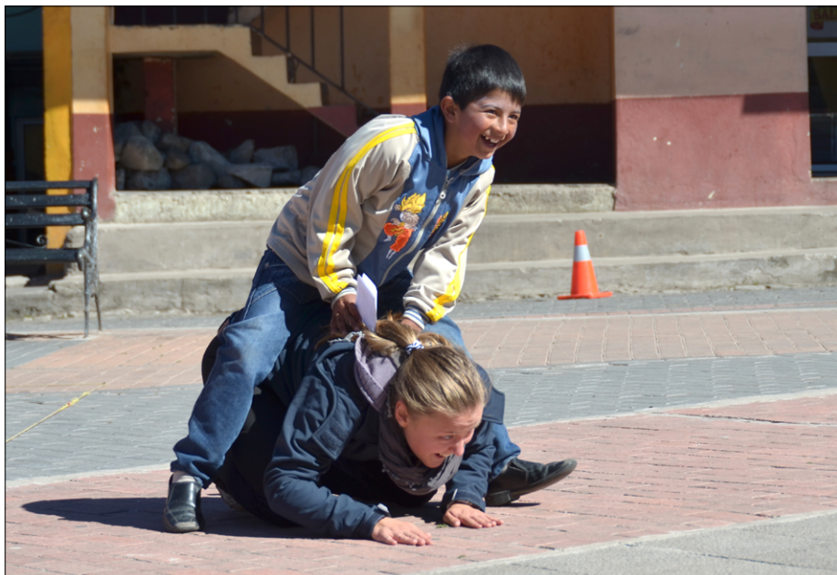
Časa za igre na trgu Salinasa je bilo več kot dovolj