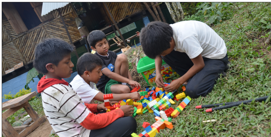
Veseli ob igračah na dvorišču prostovoljske hiše v Chazo Juanu