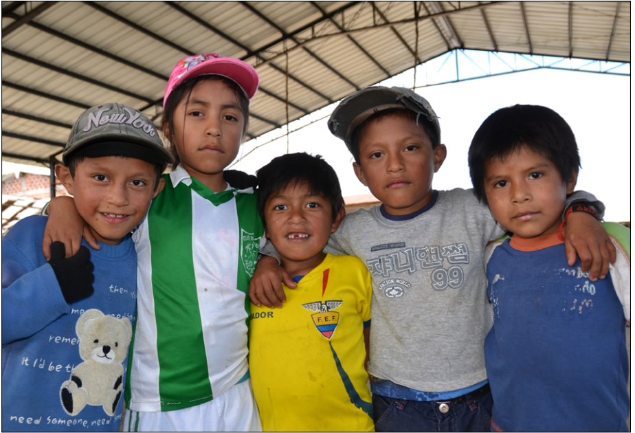
Zvedavi otroci na tržnici v skupnosti La Palma