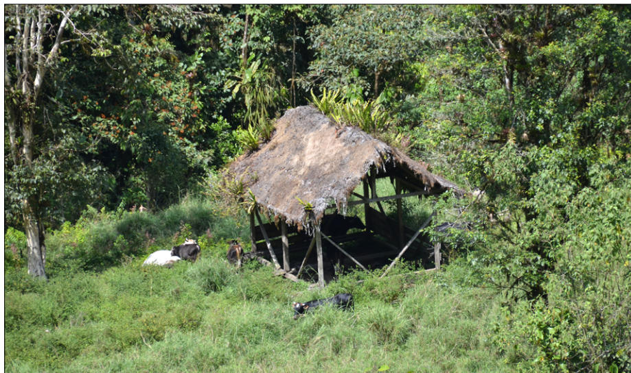
Staja za živali globoko v subtropskem gozdu