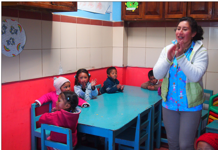
V vrtcu v Salinasu