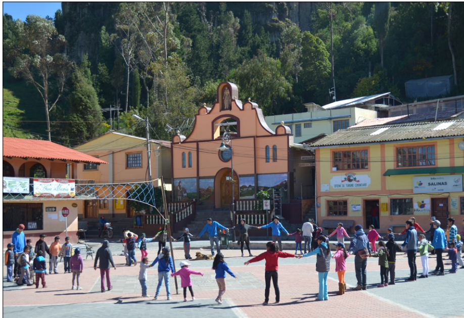
Colonia vacacional na idiličnem trgu Salinasa