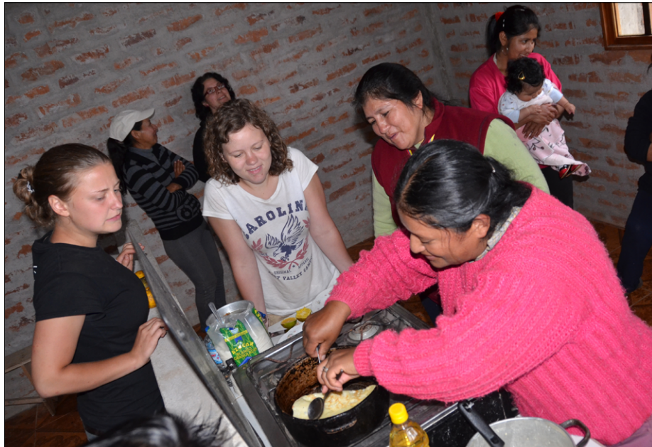
Tečaj peke palačink z ženami iz skupnosti La Palma