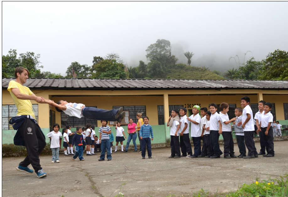
Na šolskem dvorišču v Chazo Juanu