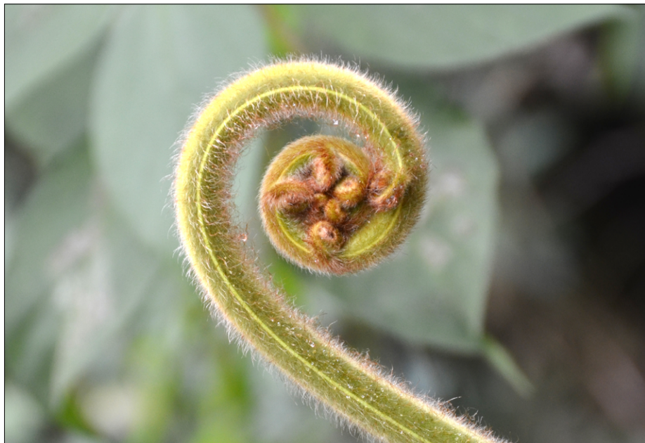
Praproť, ki doseže velikost dreves, je nastarejše živeče bitje na svetu, saj je rastle že pred 60 milijoni let