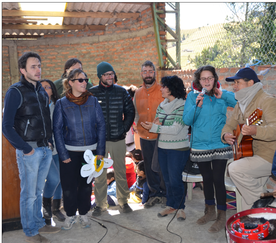
Italijanski prostovoljci in laiški misijonarji na praznovanju Dneva narave