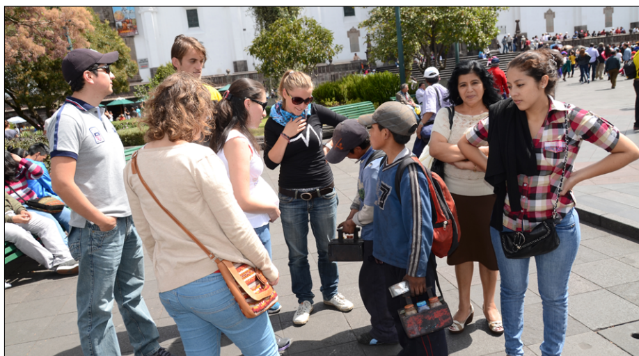
Mala čistilca čevljev v središču Quita si želita zaslužka

Hmm ... pa če bi samo o tem razmišljala, ne bi nikoli nikamor šla. Saj tudi pri nas ni z rožicami poslano.