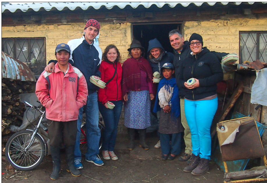
Pri rokodelki v najvišji skupnosti misijonskega področja Pachancho (4.200 m)