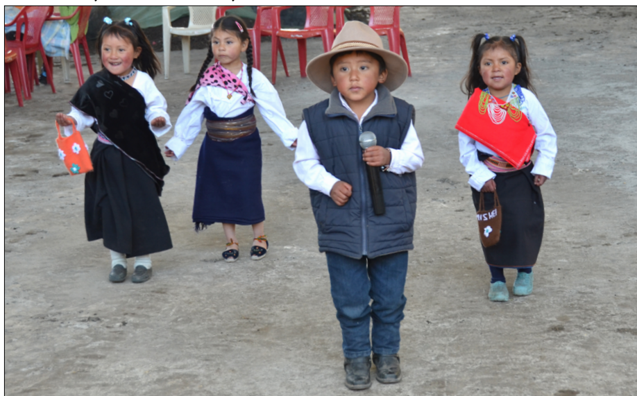
Nastop skupine na Dnevu narave v Salinasu