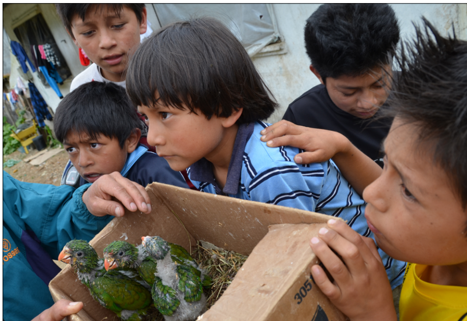
Udomačeni mladiči papige v La Palmi