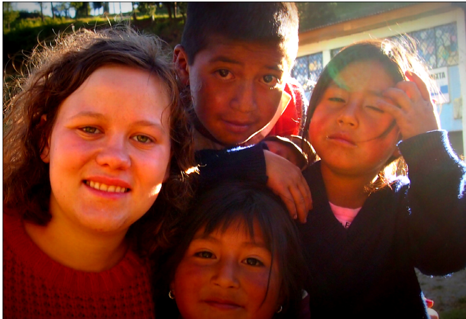
Z otroci andskih Indijancev v Apahui