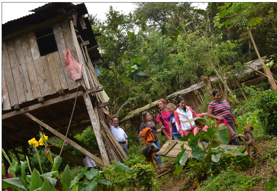
Dom Marte Chimborazo sredi bregov subtropskega gozda