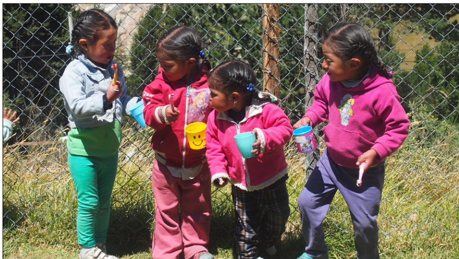
Umivanje zob po kosilu v vrtcu v Salinasu

Večkrat poslušam, kako so ljudje v Afriki, Aziji in Južni Ameriki revni, kako živijo v barakah, brez tople vode, brez postelj, kuhinj, elektrike in vsega, kar poznamo pri nas. Beseda biti reven pa ima lahko več pomenov. Mogoče so ljudje, ki smo jih v preteklem mesecu spoznali, res revni materialno, nimajo velike hiše, kopalnice s toplo vodo, elektrike in še česa, lahko pa rečem, da imajo srce, ki je daleč od tega, da bi bilo revno. Pri nas živijo bogataši, ki imajo revno srce, mi pa smo spoznali reveže z bogatim srcem. Pa sami presodite, kdo ima več in kaj je vrednejše.