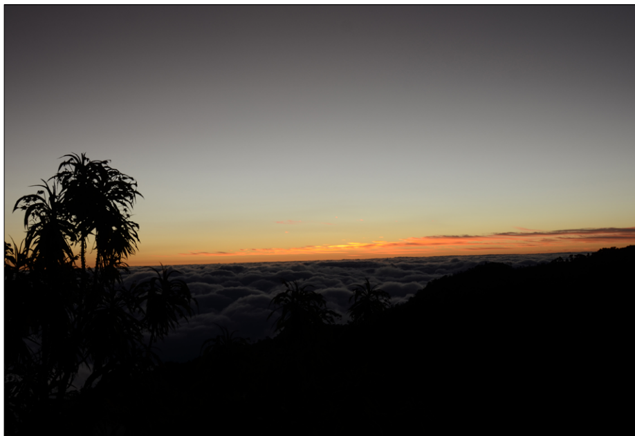
Pogled na sončni zahod v morje megle: El cima del cielo (Vrh nebes)