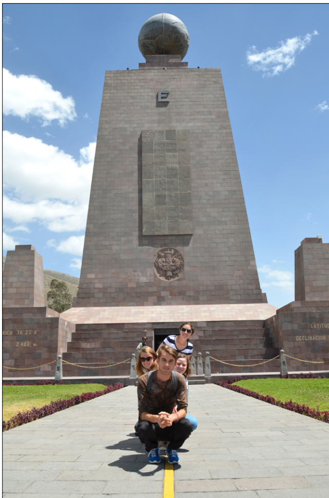
Na črti "uradnega" ekvatorja