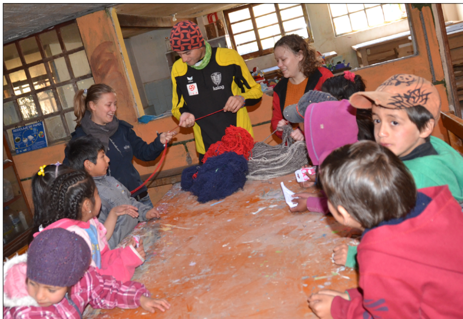
Prostovoljci pri delavnica na Colonia vacacional v Casa juvenil v Salinasu