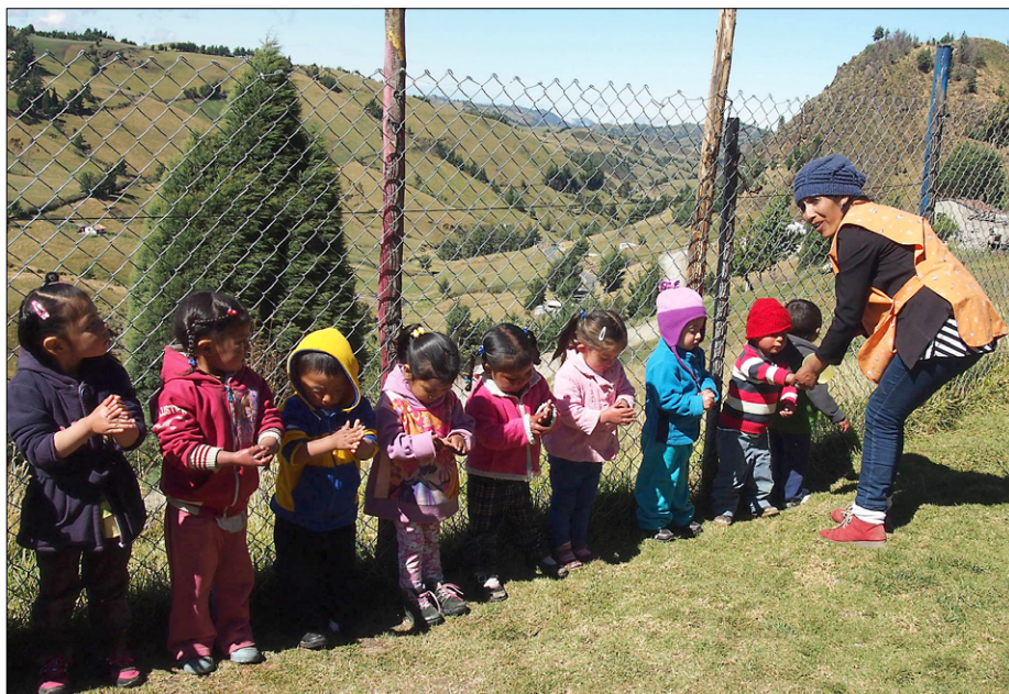
Umivanje rok pred začetkom programa v vrtcu v Salinasu