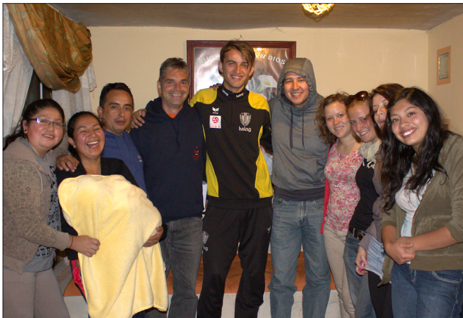
Srečanje s salezijanci sotrudniki v mestu Cayambe, Andreinem rojstnem kraju