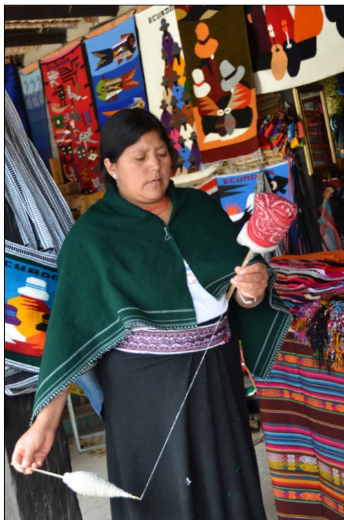
V indijanskem muzeju "tradicionalnega" ekvatorja