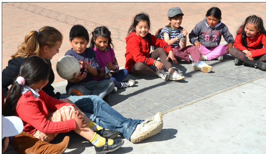
Med igro na oratoriju v Salinasu