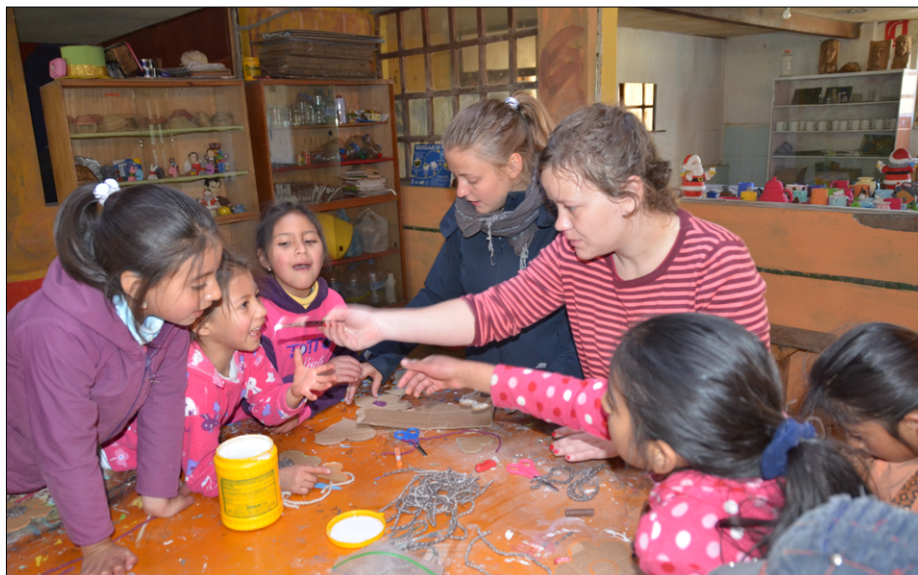
Delavnica v kleti Case Juvenil v Salinasu

Nekega popoldneva sva z Majo ostali na trgu Salinasu še po koncu popoldanskih iger in se igrali z otroki. Mimo je prišla tudi deklica, ki je imela na hrbtu navezanega približno leto in pol starega otroka. Deklica naju je prepoznala in se ustavila pri nama. Stara je 6 let, pa je sama pazila na bratca. Maja je s to deklico in drugimi otroki odšla igrat nogomet, jaz pa sem popazila na dekličinega bratca, da se je lahko ona igrala. Pri nas bi se takim