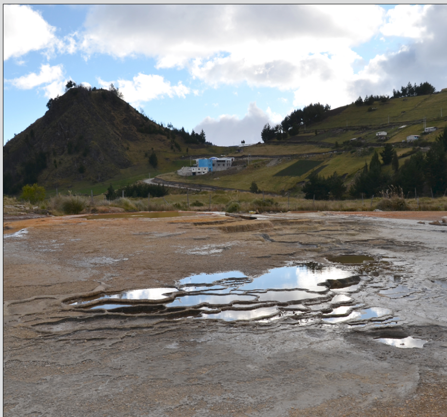
Znamenti solni grebeni, v ozadju nova sirarna skupnosti Salinas

Salinas de Bolivar je danes postal narodno in mednarodno merilo za socialni in skupnostni razvoj, po katerem se zgledujejo mnogi razvijajoči se predeli v Ekvadorju in Južni Ameriki.