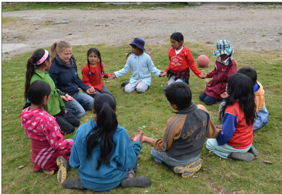
Animacija v skupnosti Apahua