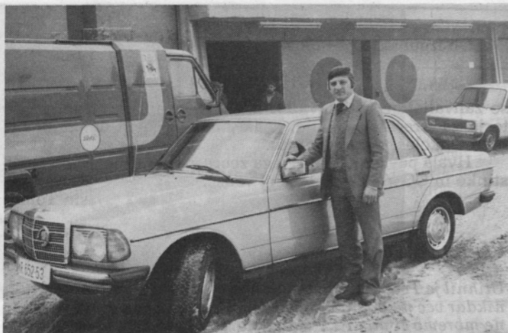
Nezadržljiva prijatelj. Skupaj sta prebila več kot 7000 ur.