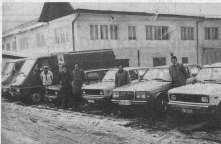
V skrbi za avtopark

V delovni enoti 301 transport imamo 29 avtomobilov. Letno prevozijo več kot milijon dvesto tisoč kilometrov. Za vse te avtomobile skrbi 18 ljudi, od tega je 14 šoferjev.