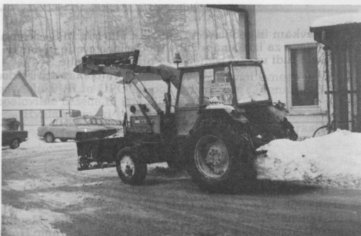
Zima nam je šele v januarju pokazala zobe. Poti je bilo treba čimprej očistiti.