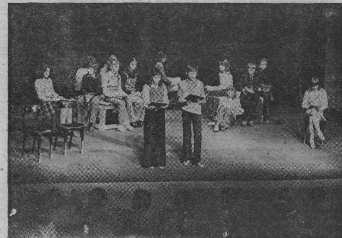
To so začetki. Morda bomo izpod njihovih peres prebrali še kaj.