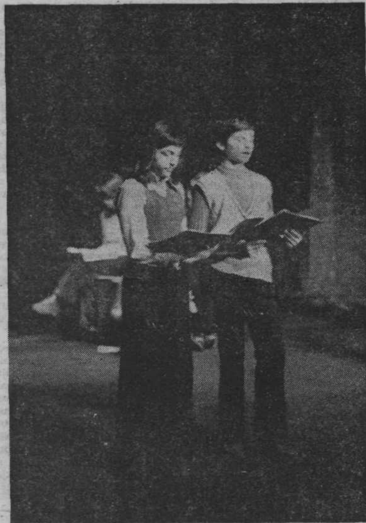
Napovedovalca sta prijetno povezovala posamezne točke.

Pa rečeš — žalosti sploh ni; a kaj to v srcu ne skeli? Sedaj še mene zmedel si. A eno vem pa za trdno: nam mladim žalost prej zbledi, ker radost v srcu še kipi.