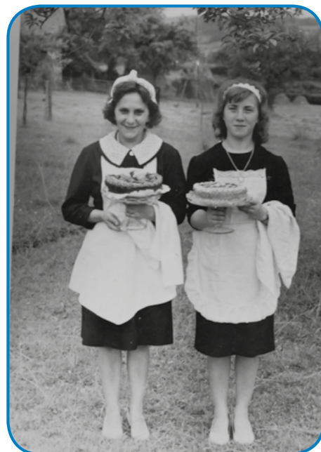
S padaškinjov sta gornostile na gostiuvanju

»Dvej leta pa pau smo še tam živeli, moja vekša hči se je še v Varaši naraudila. Potejm je mauž domau na Dörgicse odišo, zato ka tam je najšo sebi delo. Eden mali ram je kūpo pa te smo mi tō za njim odišli. Pet lejt smo tam živeli, samo stara mati so se dosta žaurgali,