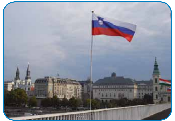
Slovenska zastava v srcu Budimpešte

Predsednik slovenske vlade, ki je izpostavil, da med Slovenijo in Madžarsko poteka »intenziven dialog na vseh ravneh in področjih«, je poudaril, da imata posebno mesto v dvostranskih odnosih obe narodni skupnosti. »Slovenska narodna skupnost v Porabju je najmanjša na Madžarskem, zato ji je treba nameniti posebno pozornost. Povedati moram, da madžarska vlada to tudi dela. Zagotavlja-