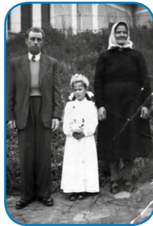
Kejpa s prve spauvedi pa birme