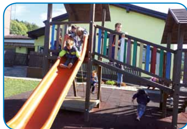
Igra na igralih pred Vrtcem Kuzma

o prijateljstvu in igri je bila otrokom zelo všeč. Sledil je sprehod do zunanega dvorišča, na katerem smo preživeli kar nekaj časa. Tam smo risali z barvnimi kredami in se igrali različne igre, ki so bile označene na asfaltni podlagi (gosenica, ristanc, številca in abeceda). Kosili smo v veliki jedilnici, kjer imajo kosilo tudi drugi učenci na osnovni šoli. Potem ko smo se dobro okrepčali, smo se še nekaj časa družili v