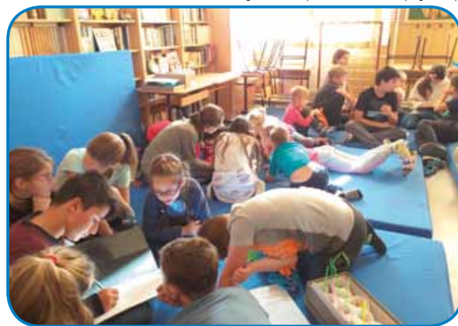
Učenci med reševanjem nalog

nja« so morali rešiti slovensko križanko, potem pa so sestavili sedem kozarcev sadne solate. Na