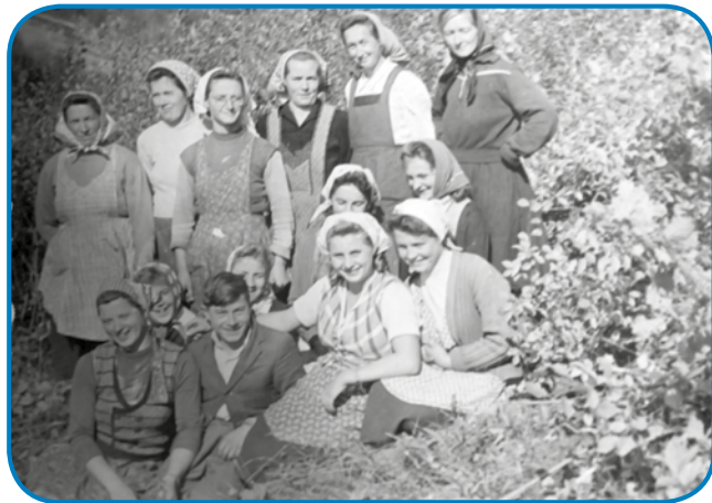
Skupina žensk pa dekel, stere so delale na grajnci

mati sončarico (napszúrás) dobila pa mrla. Prvin kak so mati na žetvo šli, name so k stari materi pelali, aj me dočas skrb ma, tak sem te ge potistim, gda je mrla, tam ostala pri njej. Oča je doma pri svoji starišaj biu, name dostakrat pogledno pa vsigdar mi je kaj kūpo, gda je prišo. Srmak, dugo je na samo živo, gda se je znauva oženo, te je štiridesetšest lejt star biu,