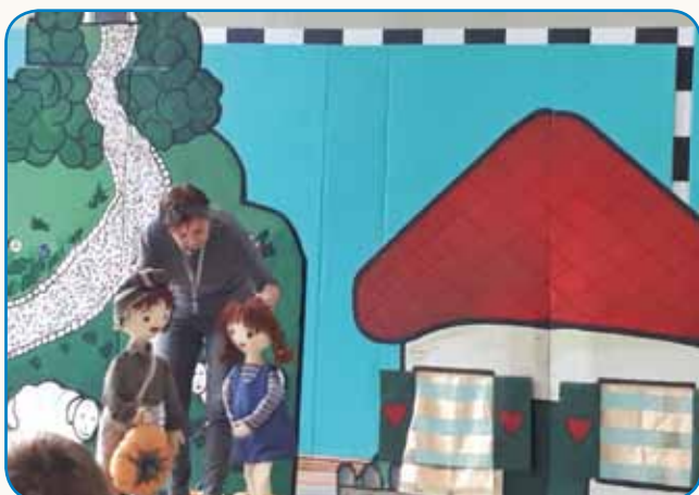
DOBRO ČEZMEJNO SODELOVANJE MED SOSEDNJIMA VRTCEMA stran 4

»MENI JE MALO NERODNO, KER NISMO ŠE NIČ KONKRETNEGA NAREDILI«