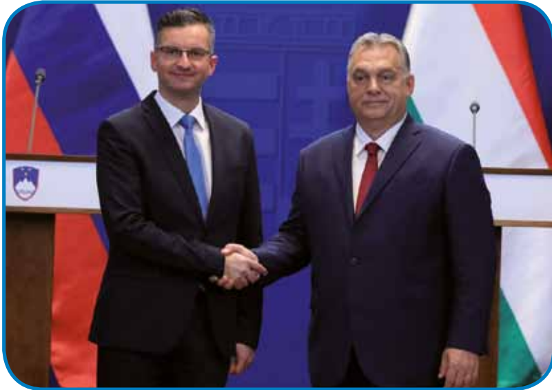
Predsednika slovenske in madžarske vlade Marjan Šarec in Viktor Orbán

tako hitro, zaradi koalicijskih vlad. Vedno je treba usklajevati različne interese. Verjamem, da če bomo imeli voljo, bomo ta cilj tudi doseg-