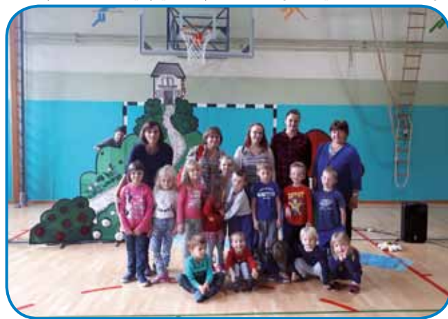
Na OŠ Kuzma

Vsako šolsko leto poteka čezmejno srečanje Vrtca Gornji Senik s sosednjim Vrtcem pri Osnovni šoli Kuzma v Sloveniji. Na dan srečanja otroci skupaj preživijo