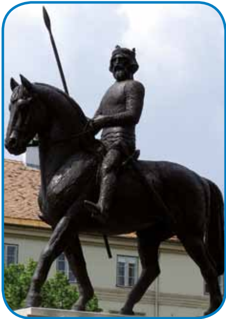
»Drügi stvoritel domovine« - kip Bela IV. v Szegedi

Gda se je v rosag povrno, je začno Bela IV. na veuko zidati. Na srejdi nauvi gradov na bregaj so stali kameni törmi, kauli nji se je zdigavala kamena ali lesena stena. V cajti tatarske nevo-