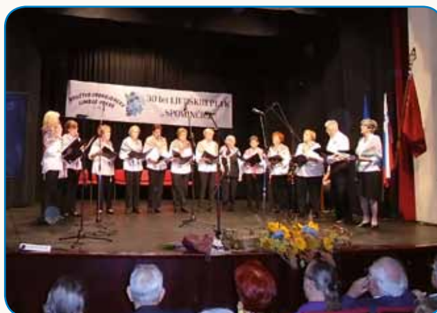
PRVO POZVANJE V SLOVENIJO stran 6