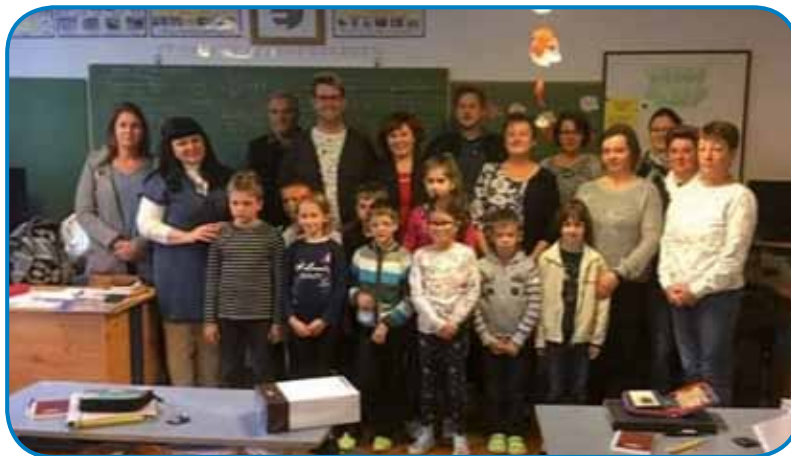
Skupinska slika vseh prisotnih pri uri slovenščine

na pogovor. Ob prijetnem kramljanju se je porodilo veliko novih idej o sodelovanjih, povezovanjih in različnih obli-