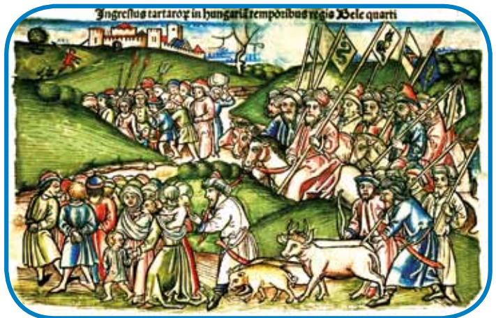
Tatarsi pred sebov ženéjo vogrsko lüstvo (kronika z leta 1488)

liki prausni nemešnjaki z županij tö. Zatok o tom srečanji gučimo kak o prvom stanovskom djilejši (rendi országyülés) na Vogrskom. Tau znamenüje, ka so lidgé, šteri so meli gnake pravice pa dužnosti, vküper gorstau-pili kak eden stan (rend), pa tak s kralom talali oblast (hatalommegosztás).