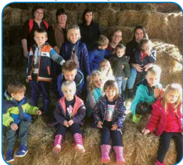
Skupinska slika na balah

Otroci so bili nad ogledom kmetije zelo navdušeni. Prijetno in