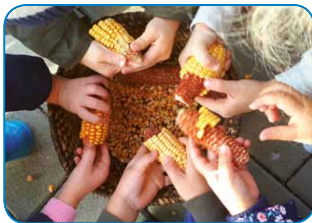
Pridne otroške ročice luščijo koruzo

li dvema delavnicama, posebej pripravljenima za nas obiskovalce. Ko smo prispeli tja, so nas na majhnem vozu že pričakale pisane jesenske buče in koruza. Koruzo smo oluščili tako, da smo odstranili koruzna zrna s storža. Spretno ročice otrok so znale to opravilo samostojno opraviti brez sleherne pomoči odraslih. Koruzo smo z vozom pripeljali v toplem prostoru s kaminom, kjer smo se okrepčali s toplim zeliščnim čajem. Nato