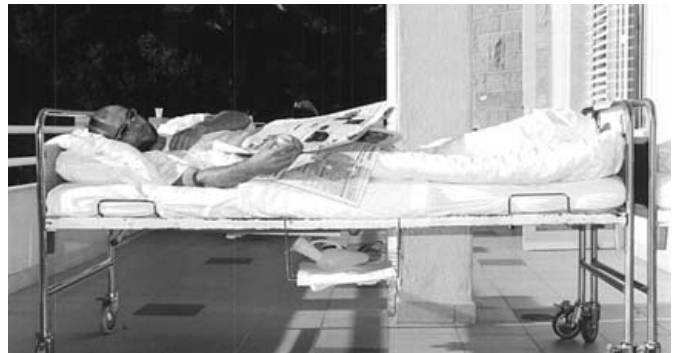
Slika 1: Preiskovanec med 35 dnevnim mirovanjem

Vse aktivnosti preiskovancev smo spremljali s 24-urnim video nadzorom. Preiskovanci so bili predhodno podrobno obveščeni o poteku raziskave in stopnji tveganja.