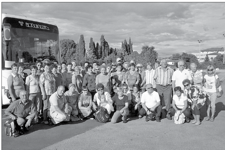
Prostovoljci so za nagrado za svoj trud uživali v Izoli.