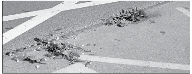
Na Ljubnem ob Savinji se večkrat dogaja, da morajo lastniki hiš v središču kraja zjutraj počistiti svojo okolico.

Na Ljubnem se večkrat dogaja, da morajo lastniki hiš v središču kraja zjutraj počistiti svojo okolico, predvsem ob sobotah in nedeljah zjutraj ter po nekaterih prireditvah v kraju. Najbolj na udaru so hiše ob cesti, pa tudi šola ter njena okolica. V preteklih letih so korita z rožami na mostu na Ljubnem pogosto končala v vodi, včasih so nepri-