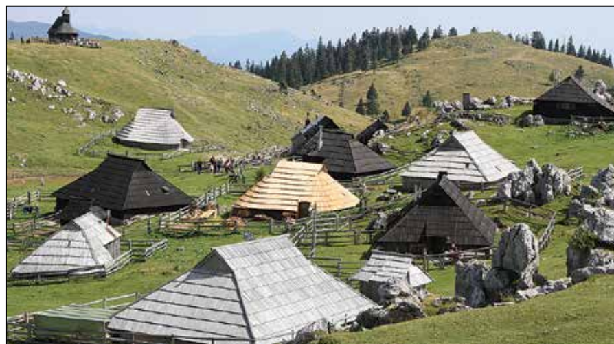
Slikovita travniška planota je polna nezahtevnih poti, planinskih domov in zavetišč ter pastirskih bajt.

letnih časih. Manjši sestoji smrekovega gozda in iglastih osamelcev se izrisujejo na zelenih travnikih in kot bi slikar slikal na umetniško platno, tja pod skalno gorovje Kamniško-Savinjskih Alp in Karavank.