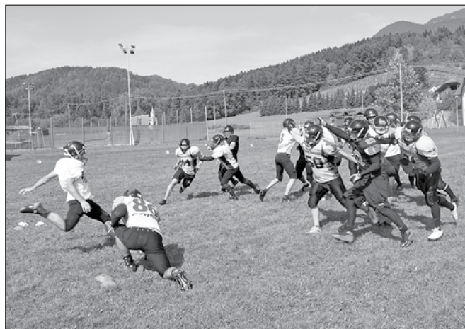
»Zlati kopači« v akciji