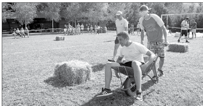
Vožnja v samokolnici je lahko tudi adrenalinska.