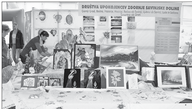
Predstavitve društev upokojencev Zgornje Savinjske doline na MOS-u.