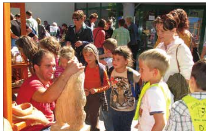
Oblikovanje podob iz lesa je navdušilo tudi male obiskovalce prireditve.

v Sloveniji v izobilju, vendar lesa ne znamo uporabiti sebi v prid. Sekanje in prodaja lesa v tujino je pot k opustošenju naših gozdov, je opozoril Bervar, zato ne smemo dovoliti, da bi postali kolonija za izvoz