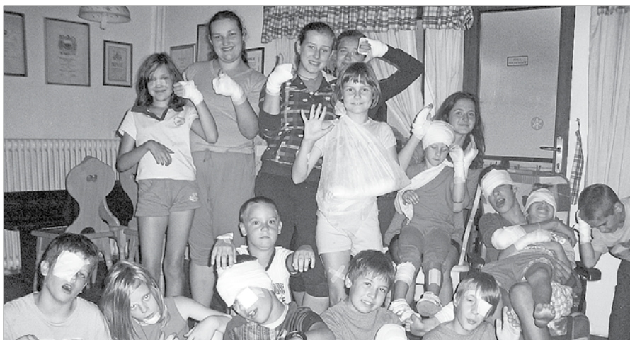
Ne, nismo imeli nesreče, samo tečaj prve pomoči.