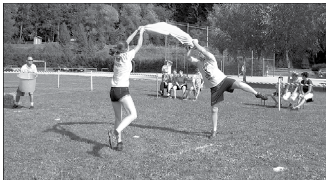
Čeprav Labodjega plesa tega dne ni bilo na sporedu, so se nekateri tekmovalci odločili za popestritev dogajanja s kulturnimi vložki.

zabavnih iger, na katerih so se pomerile štiri ekipe. Žal letos ni bilo ekipe iz Šmartnega ob Dreti, tako da jim nehvaležno mesto zadnjega pripada že po dolžnosti. So se pa za mesto najboljšega toliko bolj pogumno borile ekipe Kokarje 1 in 2, ekipa Nazarje in letošnja novost na igrah, ekipa Mladiči Kokarje. Slednjo je sestavljal podmladek v pravem pomenu besede, saj večina članov ekipe še ni dopolnila niti enega desetletja.