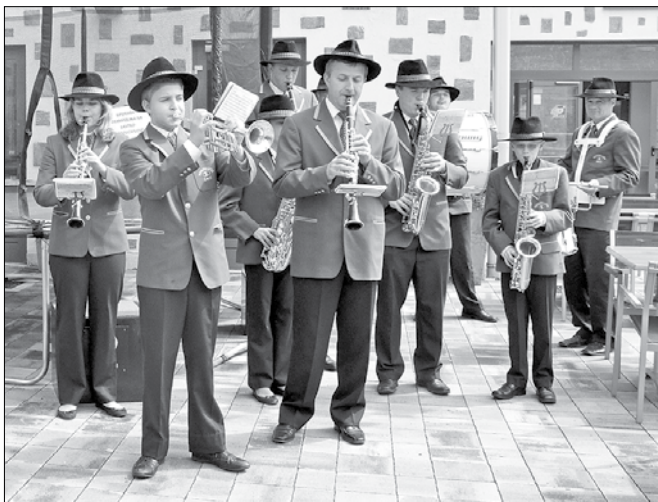
Lovci in ostali udeleženci lovskega praznika so lahko prisluhnili nastopu Laške pihalne godbe.