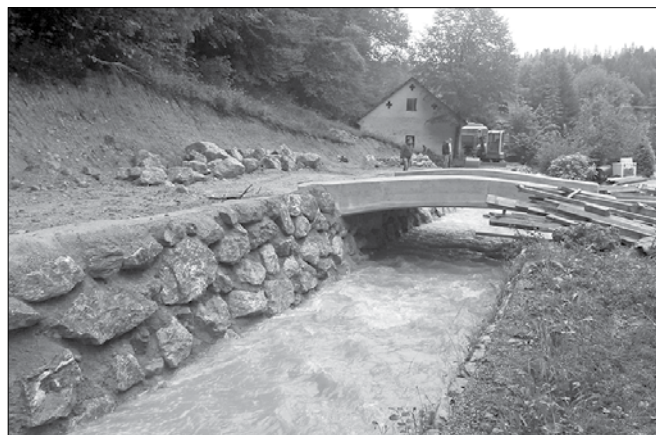
Prenovljen most in kamnita zložba v Dol-Suhi

Pred delom na samem plazu v Dol-Suhi je bilo potrebno prenoviti obstoječi most, zgradili so kamnito zložbo in utrdili brežino ter tako povečali poplavno varnost in pretočnost potoka Rečica. Sedaj potekajo dela na ureditvi razmer na plazu; začenjajo z odstra-