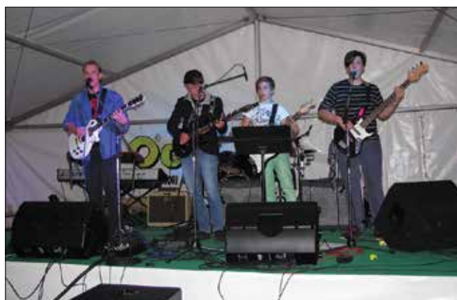
Na lesarskem žuru, ki je sledil popoldanskemu dogajanju, so mladi glasbeniki poskrbeli za živahen zaključek praznovanja.