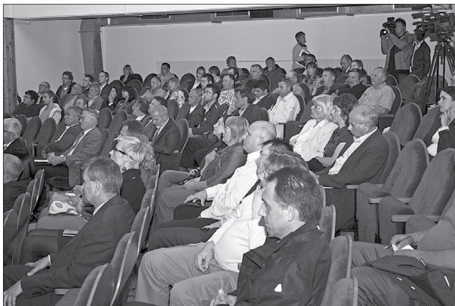
Udeleženci šeste razvojne konference in srečanja slovenskih lesarjev