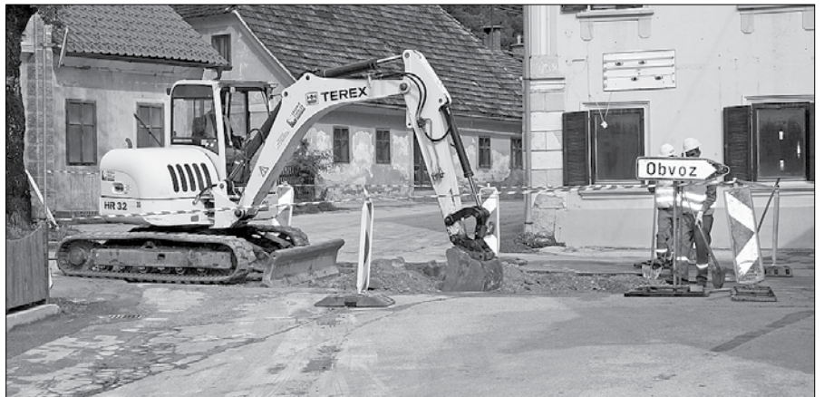
Gradbena dela na cesti v Rastke