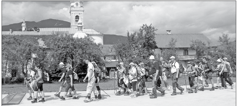
Romanja, ki je bilo dvajseto po vrsti, se je udeležilo 92 romarjev iz 18 župnij.