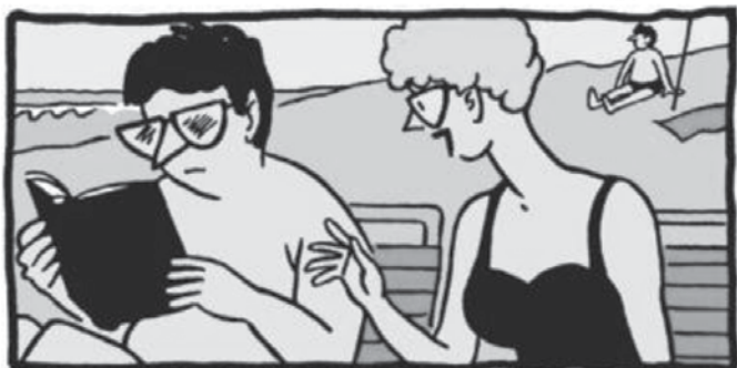
Naj ti očistim očala, dragi, umazana so.