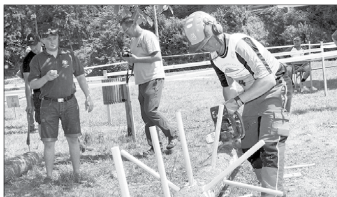
Pri kleščenju gre za »bitko« s časom.

Tudi letos so se tekmovalci pomerili v zaseku in podžagovanju, preciznem rezu na podlagi, kleščenju, podiranju na balon ter preverjanju znanja in brezhibnosti »motorke«.