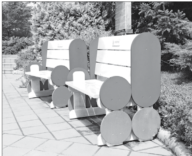
Donacija Belinke že krasi izbrane sprehajalne poti v Mozirskem gaju.

Prijateljstvo je tudi tema Belinkine akcije Prijateljstvo za vedno, v okviru katere se je Belinka odločila za donacijo klopi različnim parkom, otroškim igriščem in športnim zavodom po Sloveniji. Belinka, ki je izdelala lesene klopi, je z donacijo Mozirskemu gaju želela pomagati pri nadomestitvi dotrajanih klopi v parku in s tem obiskovalcem parka omogočiti nemoteno uživanje v lepotah in blagodej-