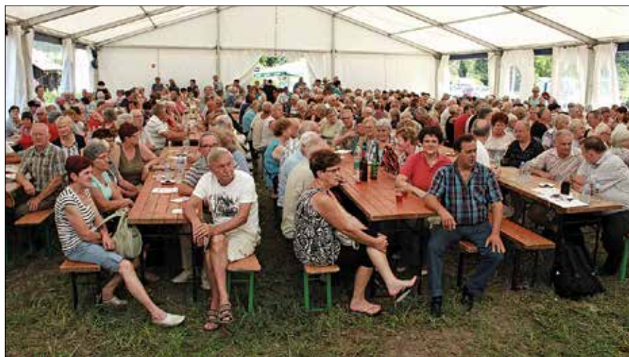
Na Hočevarjevih njivah se je zbralo domala 500 upokojenk in upokojencev iz vseh društev, ki delujejo na območju Zgornje Savinjske doline.