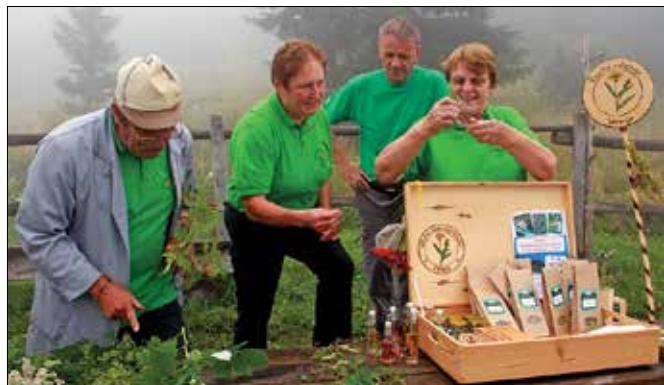
Velenjski zeliščarji so pohodnike ozaveščali glede ohranjanja narave in nabiranja ter predelave gorskih in drugih zdravilnih rastlin.

skovalci Golt, saj so sprehodi do Starih stanov, umetnega jezera Pri treh plotih, na Medvedjak in drugam izjemno doživetje, nedeljska megla in hlad pa sta mnogim prekrizala načrte, zato je bil obisk planine precej skromnejši.