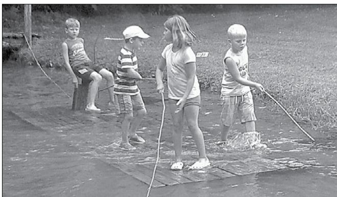
Na delavnici izdelave flosov pri Budnovi žagi