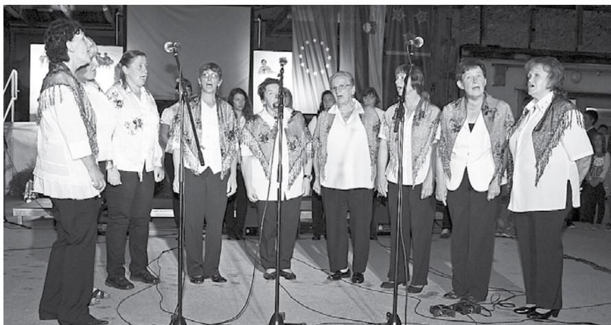
Različni pevski sestavi, ki delujejo na Solčavskem, so garancija za nadaljevanje tradicije in negovanje lokalnih glasbenih posebnosti.

kov s turistično infrastrukturo, informativnimi tablam, klopami in mizami, ležalniki, mostički, zavetišče za kolesarje, razgledno ploščad z najlepšim pogledom na Logarsko dolino.«