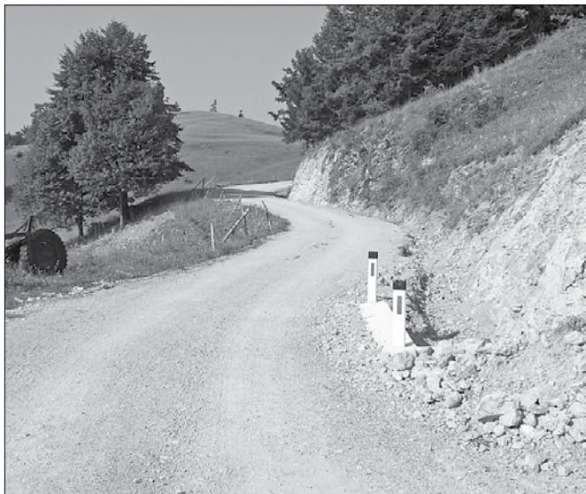
Prenovljeni del ceste Borseka-Ston

V minulih dneh je bila zaključena sanacija ceste Borseka-Ston, ki jo je za Občino Rečica ob Savinji izvajalo celjsko podjetje VOC. Za omenjeno sanacijo je občina od države uspela pridobiti nekaj manj kot 36.000 evrov nepovratnih sredstev za odpravo posledic po žledu v letu 2014.