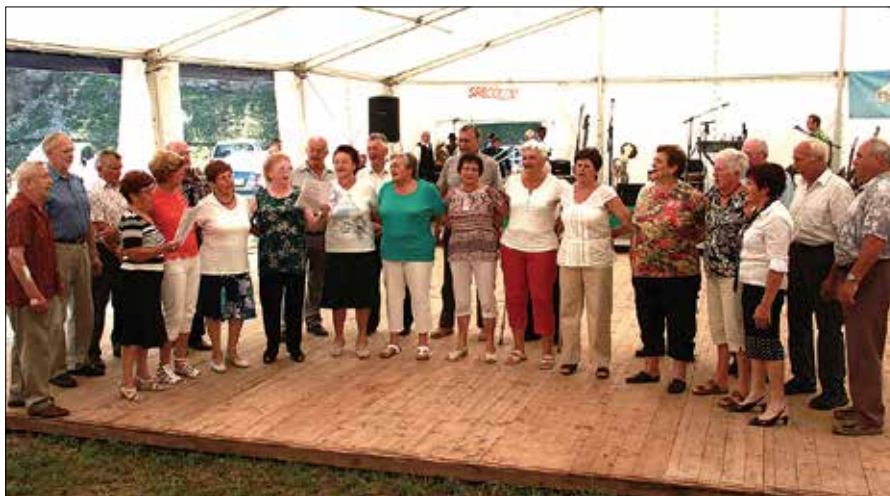
V kulturnem programu je nastopil tudi združeni pevski zbor lučkih upokojencev.