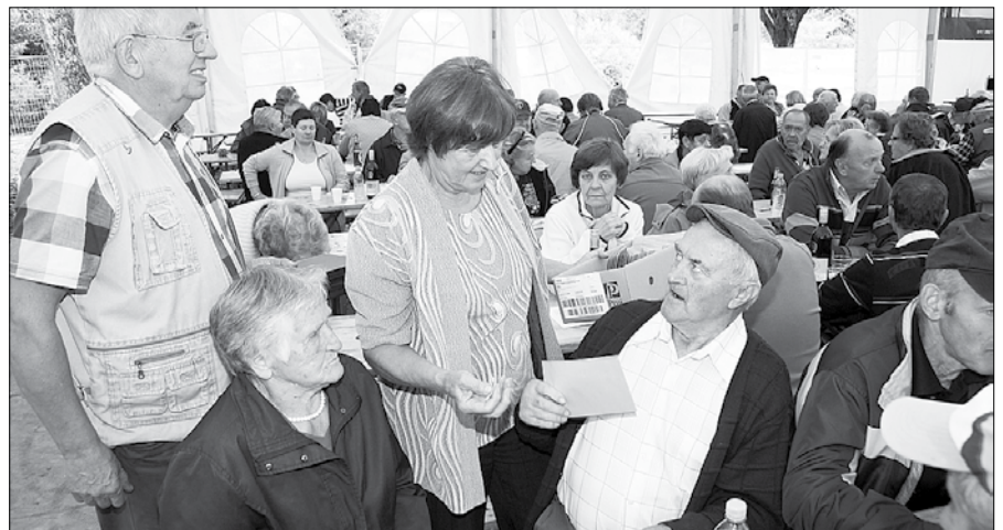
Društvo upokojencev je tudi letos poskrbelo za tradicionalni piknik z okusno hrano, srečelovom in prešernim vzdušjem med udeleženci.