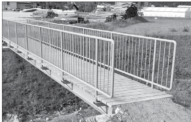
Nova brv bo sestavni del pešpoti od mostu čez Savinjo v Nazarjah do poslovne cone Prihova.