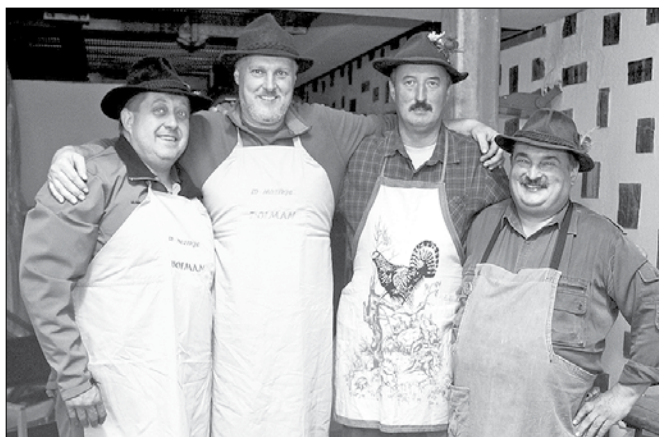
Prerivanja za prvo mesto ni bilo, saj so lovci predvsem prijatelji in nadzorniki življenja v naših gozdovih.

Na gosto zamegljeno planino so prišli tokrat na prijetno dolžnost trije kuharski pari: za Mozirjane Bo-