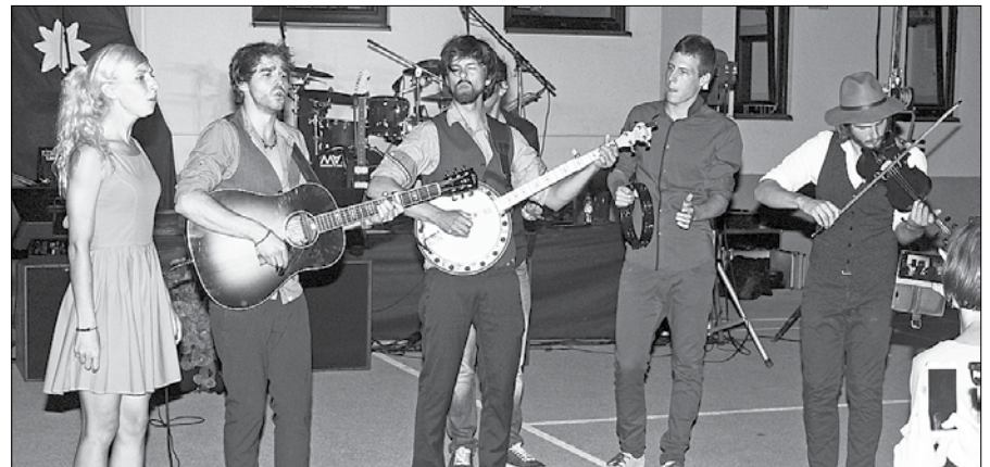
Nastop skupine Čedahuci v Lučah