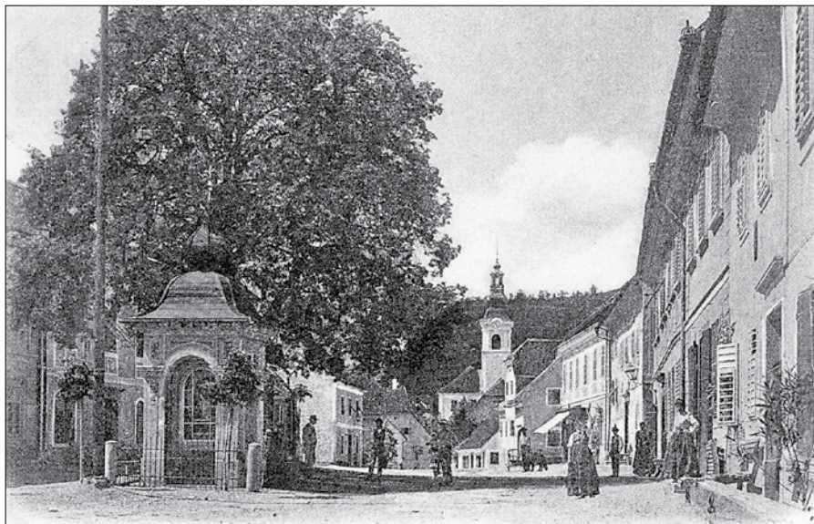
Mozirje ob koncu 19. stoletja

Nič drugače ni bilo pri nas v časih narodnega prebujenja. Ko je marčna revolucija leta 1848 marsikaj spremenila in tedanjo absolutistično Avstrijo privedla do parlamentarizma in postopne demokratizacije vladavine, je seveda male narode nekoliko osvestila. Toda bilo je potrebno