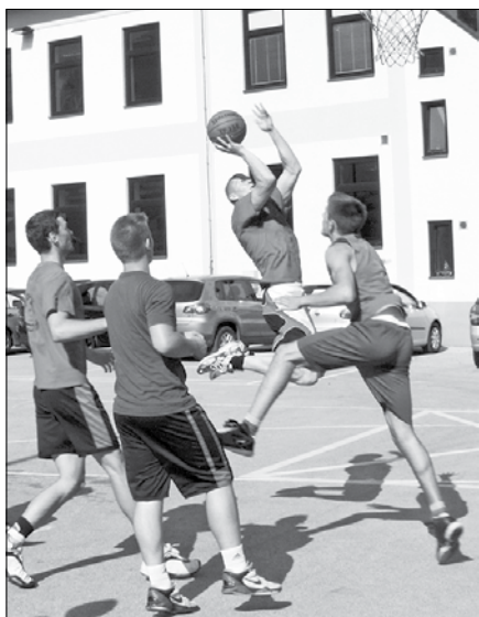
Gledalci so v Lučah lahko videli veliko dobrih košarkarskih akcij.