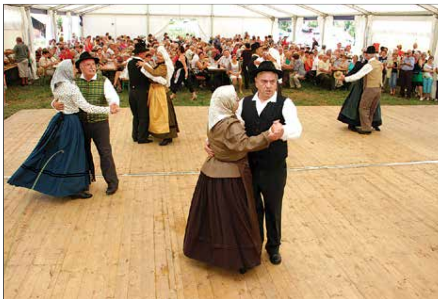
Člani folklorne skupine Oštarija iz Bočne so zaplesali množici upokojencev v Lučah.