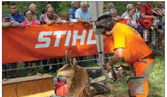
Obiskovalci so z zanimanjem opazovali, kako so izpod rok novodobnih kiparskih mojstrov nastajale različne lesene umetnine.