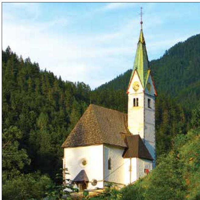
Solčavska cerkev je od leta 1987 zaščiten kot kulturni spomenik lokalnega pomena.

Najbrž je že v 12. ali najkasneje v 13. stoletju na tem mestu stala cerkev, kar izpričujejo romanski ostanke gradnje v zakristiji, pisna omemba predhodne cerkve iz leta 1365, še bolj pa dendrokronološke analize tramov ostrešja v cerkvi. Raziskovalci Gozdarskega inštituta Slovenije so analizirali njihovo sta-