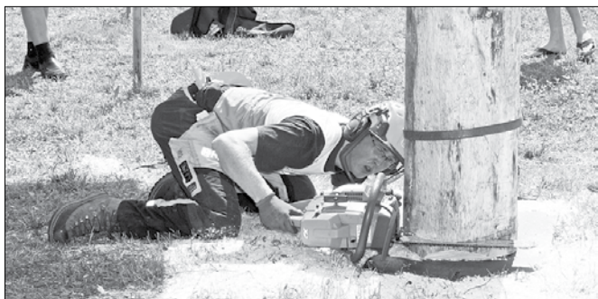
Za precizen rez je treba imeti tudi oster vid.