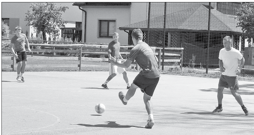
Čeprav na turnirju ni sodelovalo veliko ekip, so bile tekme zanimive in gledalcev ob igrišču niso pustile ravnodušnih.

V okviru športnih dogodkov občinskega praznika na Ljubnem ob Savinji je potekal tudi turnir v malem nogometu, na katerem je sodelovalo osem ekip iz širše okolice Ljubnega.