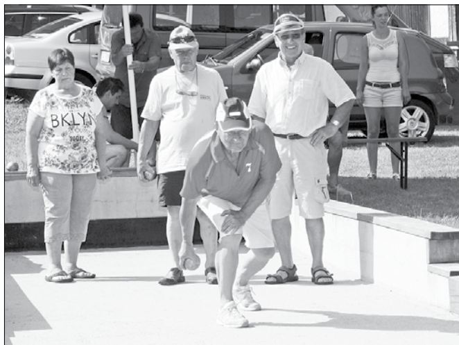
Ker so vse tri ekipe dosegle enako število zmag, so o končni uvrstitvi odločale razlike pri osvojenih točkah.