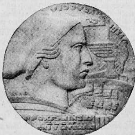
Slotska značka (Rad kipara A. Dolinara iz Beograda)

Vse to naj bo vaša skrbna priprava za zlet! Na delo! Zdravo!