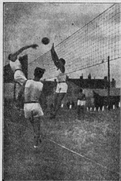
Lep momenat u odbojci