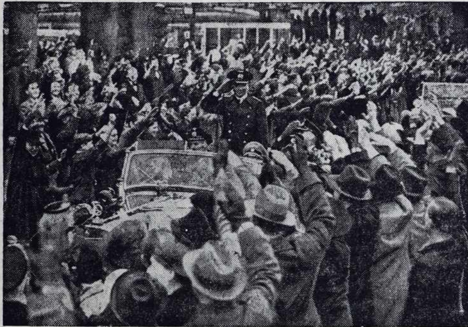
Litva proslavlja povratek mesta Vilna v svoje območje.

Vidonci. Naša šola ma pet razredov i po najnovjšem ostanela na šoli samo dva učitelja. Radi bi znali mi Vidončarje, ka de naša deca znala, či de vsakši drugi den samo šla v šolo. Po leti jo doma stavljamo, po zimi pa školnikov nemamo! Prosimo višišo oblast, ka nam pošle školnike, ka de naša deca mogla redno včiti.