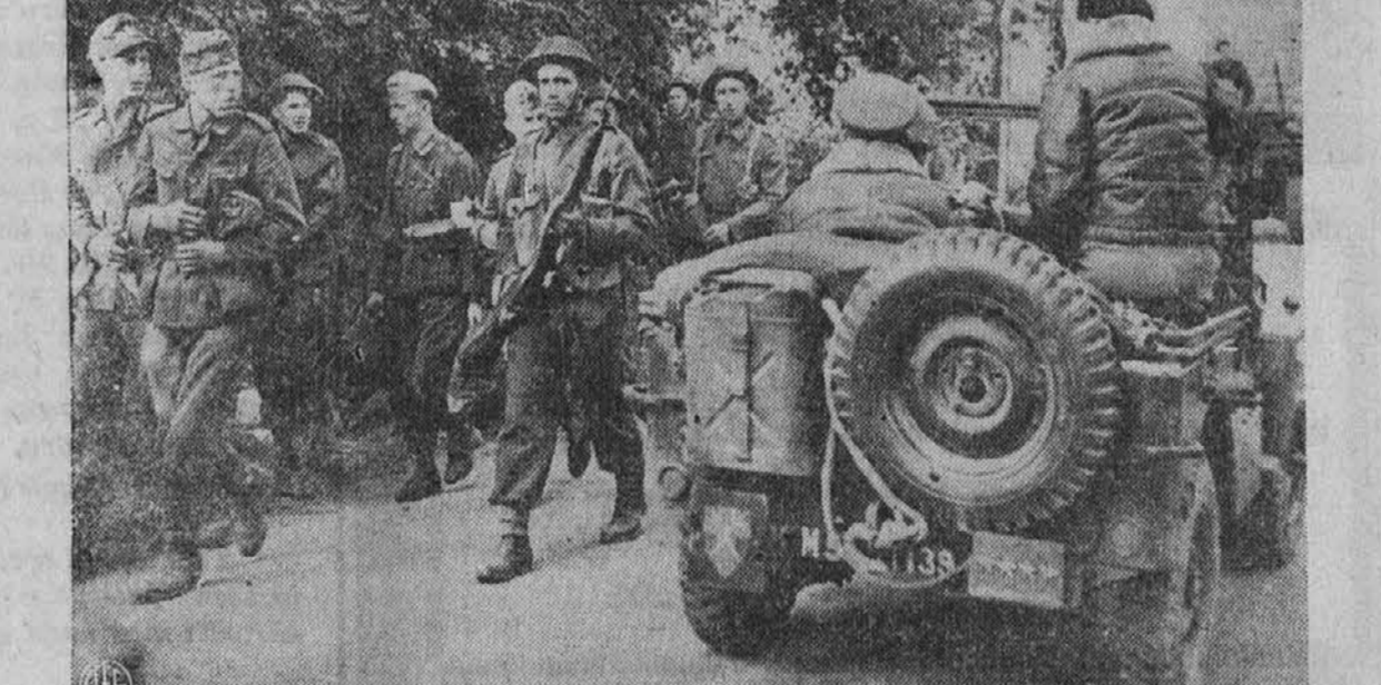
Torej to je Monty! — Mladi nemški vojak, katere so zavezniki zajeli v prvem nastoku v Franciji, z zanimanjem vro poveljnika britskih invazijskih čet generala Sir Bernard L. Montgomery-ja, ki sedi v "jeep" avtu na desni. General Montgomery je osebno obiskal invazijsko fronto v Franciji.