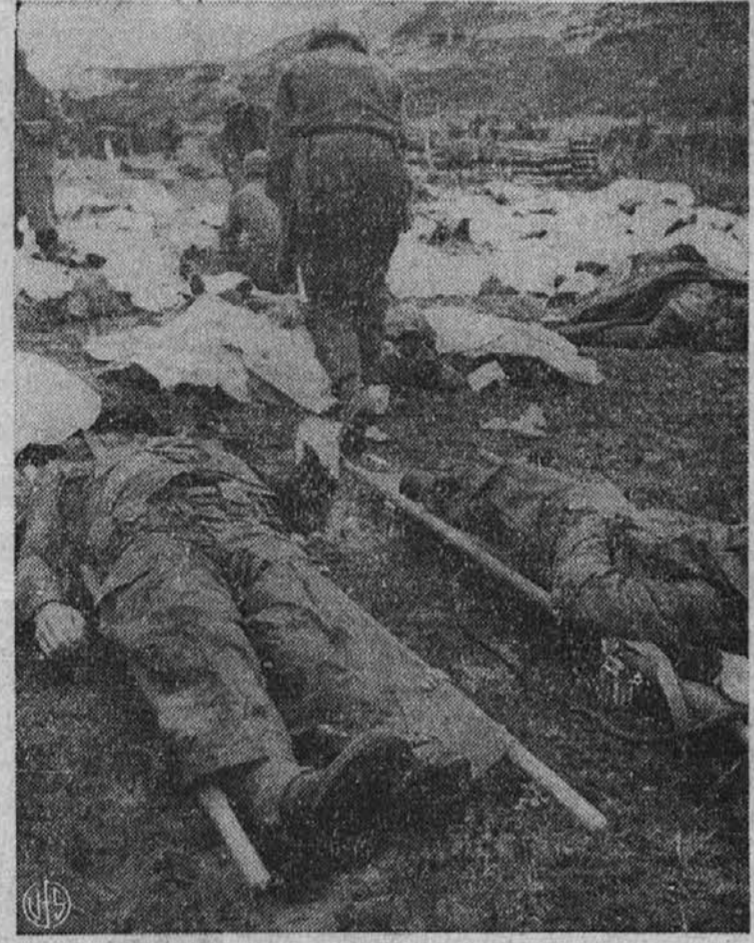
V smrti so vsi enaki. — Ameriški in nemški fantje, ki so obležali na bojnem polju leže drug poleg drugega...