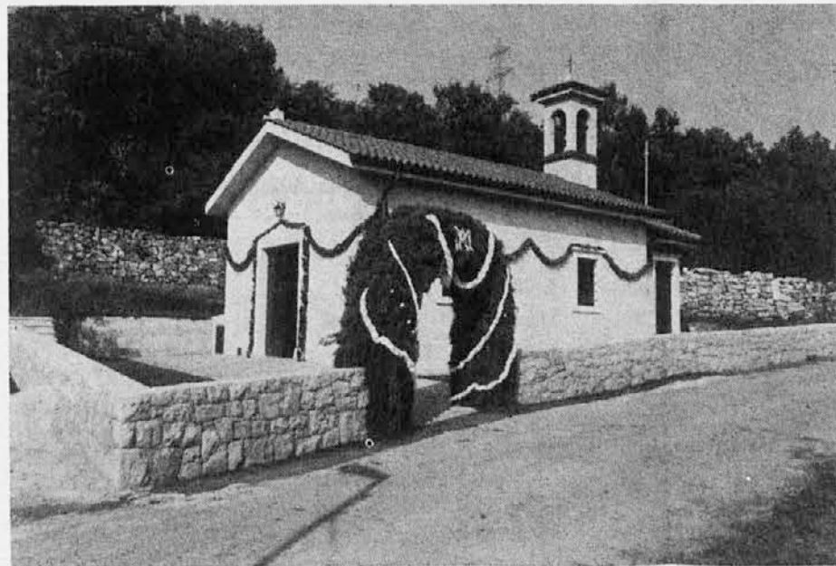
Nova cerkvice sv. Cirila in Metoda v Cerovljah, župnija Mavhinje