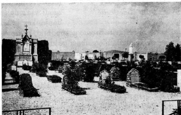
Uršulinski grobovi na ljubljanskem pokopališču

Mrtvim smo mi torej dolžniki. Zato hitimo k njim s cvetjem v rokah. In tedaj utihnejo v nas vse strasti, vse sovraštvo. Danes morda bolj kot kdaj