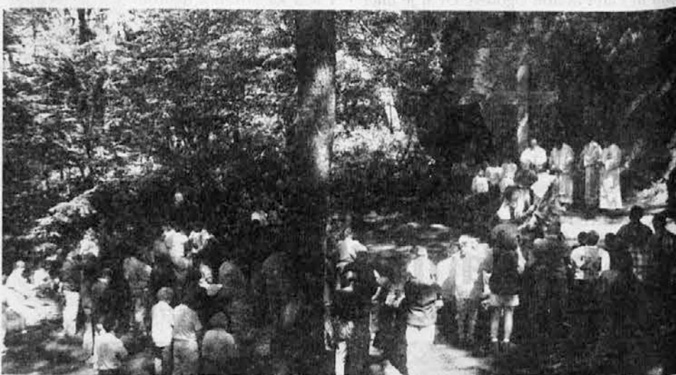
Pogled z vrha Skalce na planince pri maši