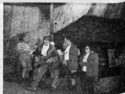
Zgoraj: Pevski nastop skupine gostov iz Slovenije