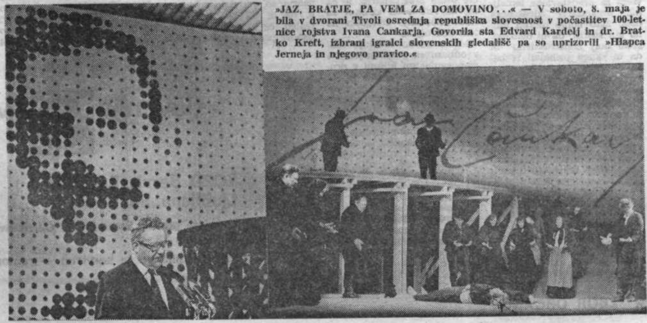
»JAZ, BRATJE, PA VEM ZA DOMOVINO...« — V soboto, 8. maja je bila v dvorani Tivoli osrednja republiška slovesnost v počastitev 100-letnice rojstva Ivana Cankarja. Govorila sta Edvard Kardelj in dr. Bratko Kreft, izbrani igralci slovenskih gledališč pa so uprizorili »Hlapca Jerneja in njegovo pravico.«

Sindikalna organizacija v Splošnem obrtnem podjetju je v torek zjutraj sklenila, da bo 38-članski kolektiv prispeval enodnevni zaslužek, nekaj denarja bodo primaknili še iz sklada skupne porabe, tako da bodo prizadetim poslali 10.000 din. To je zgleden primer solidarnosti tega majhnega kolektiva, ki bo prav gotovo našel še mnogo posnemovalcev.