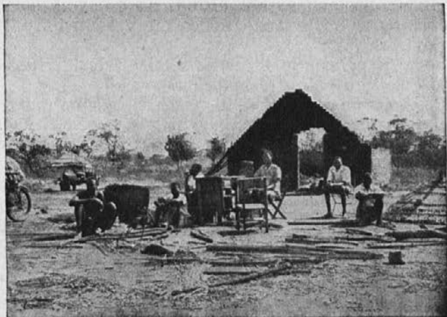
Ubogi misijonarji, vihar jim je odnesel streho.

Velike skrbi nas mučijo, kako bo v prihodnje s posameznimi postajami. Zaradi druginje žele imeti naši katehisti povečane plače. Ker jim ne morem plač povečati, so si nekateri poiskali zaslužek drugod. Nadomestili smo jih z drugimi, a tudi ti ne bodo mogli živeti ob tej plači.