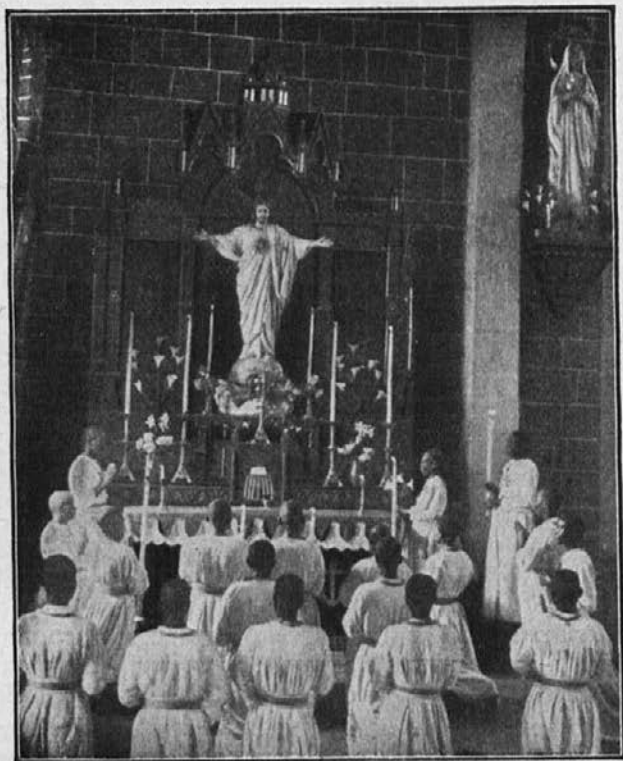
Presveto Srce Jezusovo, tvoji smo!