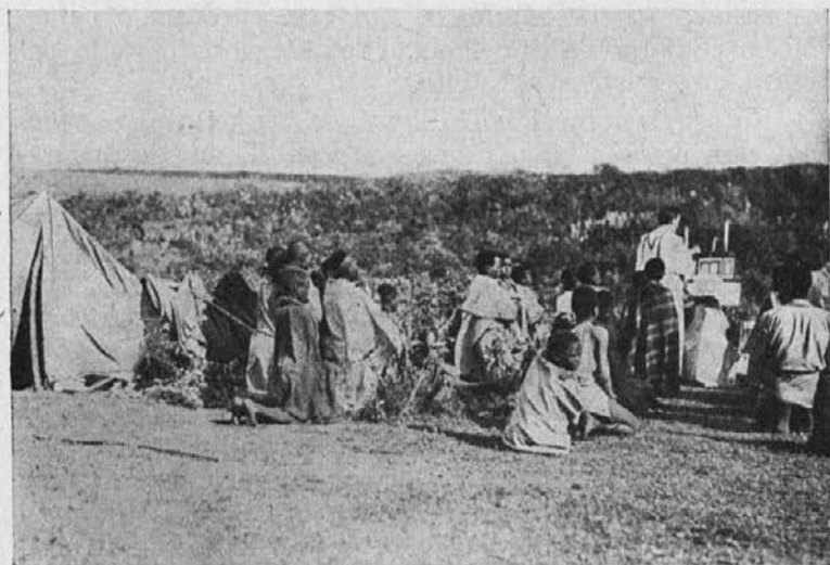
Sveta maša na prostem, ker še ni misijonske cerkvice.

Tu imamo samo eno preprosto belo mašno obleko, ki je že precej obrabljena. Pater superior bi zelo rad, ko bi se mogla dobiti za velike praznike nova in lepša mašna obleka. Morebiti bi vi vedeli za kakega velikodušnega dobrotnika?