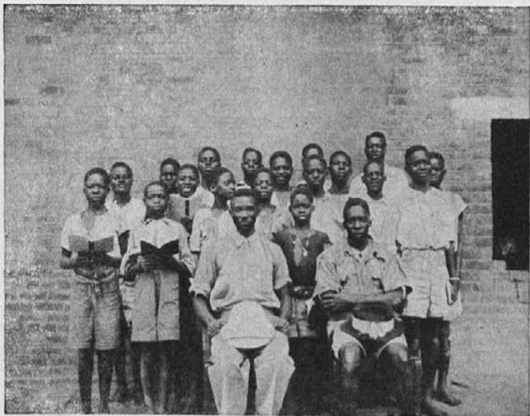
Zamorski katehist s svojimi pridnimi učenci.

»To naj vas nič ne skrbi, dragi moj. Ako morete pogrešiti 100 din za eno mesečno podporo zamorskemu katehistu, kar pošljite jih! Zaupajte, da bo božja Previdnost našla še drugih dobrotnikov, ki bodo plačali še za ostale mesece.«