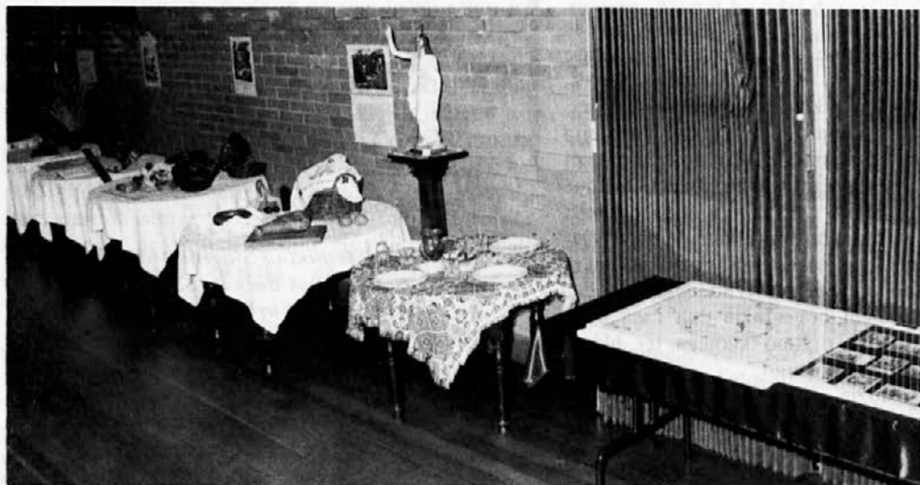
Razstava "Veliki teden pri nas doma", ki je bila v naši dvorani pred veliko nočjo.

je začel p. Bazilij v oktobru 1956. Tako je do sedaj v naših poročnih knjigah zabeleženih 1749 parov, v krstnih pa že več kot 2730 imen. P. Klavdij in drugi slovenski patri so pred tem tako poroke kot krste vpisovali le v knjige različnih župnij. Največ vpisov krstov je najbrž v knjigah župnije Srca Jezusovega v Kewju, kjer je p. Klavdij na božič leta 1952, precej verjetno kot prvega iz naše skupnosti, krstil Erika Gregoriča.