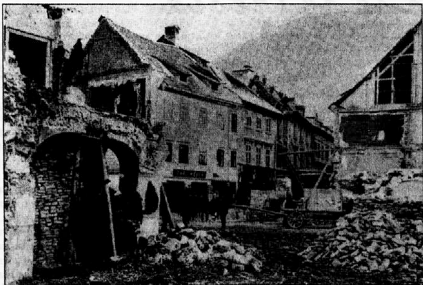
Ena ljubljanskih ulic v razvalinah potresa 1895