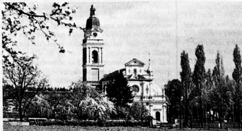
Bazilika Marije Pomagaj- Kraljice Slovencev na Brezjah

/Iz njegovega pisma častnemu odboru za obeležje 50. obletnice druge svetovne vojne in zmage nad fašizmom in nacizmom./