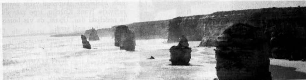
"Dvanajst apostolov" ob Great Ocean Road, Victoria.

Obdobje let 1941 - 45 je kljub neovrgljivemu idealizmu večine slovenskega rodu, ki se je v partizanstvu in njegovem vojaškem nasprotstvu najdevalo na razdvojenih okopih, temen in krvav čas, ki ga je dolga leta pričakovala združba ideoloških avanturistov, zapriseženih leninističnemu praporu k svetovni revoluciji in republiki sovjetov v deželi naših očiakov. Preživeli, postarani in zakrknjeni Stalinski vojščaki in njihovi preoblečeni potomci počenjajo vse, da bi svoje revolucionarne bratomorne brigade vštutili v obrede vojnih veteranov, ki so se pod zastavami svobodnega sveta bojevali proti silam fašistične osi, ne da bi pri tem iztrebljali življenja svojega lastnega naroda. Rodoljubi raznih narodov so se pod zastavami Zahoda bojevali za Evropo, medtem ko so "osvoboditelji" v imenu socializma boljševistične pravovernosti prav v tistem času redčili vrste našega naroda in se končno na dan svobodne Evrope prepustili požastni moriji. Z zvezdami krasnoarmejevc na triglavkah, z "matildami" in komisarji bi se radi pomešali med mastrovce, med tigrovce in uporne nacionaliste izpod Pohorja. Misel, da bi se po petdesetih letih slovenskega Katyna načrtovalci revolucije postavljali Eisenhowerju v bok, je groteskna, je rabeljski humor.