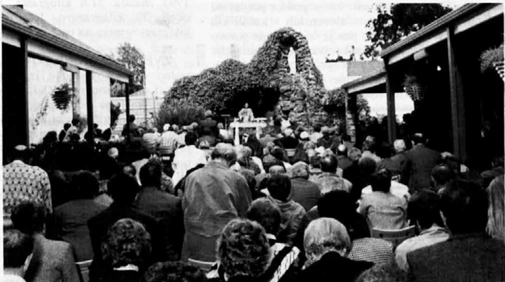
V Melbournu smo pričeli veliki teden na prostem pred lurško votlino.