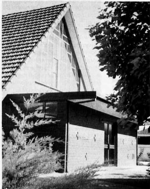
Pročelje slovenske cerkve sv. Družine v Adelaidi

Je pa bilo za Vstajenje letos več ljudi kot ponavadi in tudi na velikonočno nedeljo je bil lep obisk.