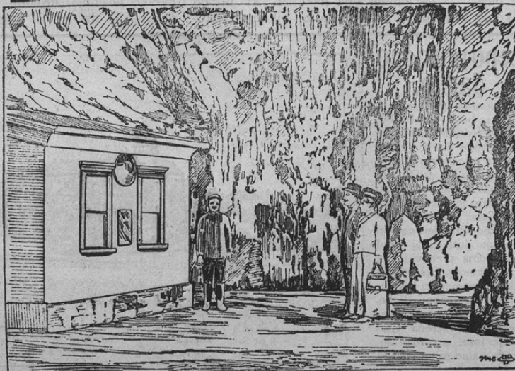
Das unterirdische Postamt in der Adelsberger Grotte.

Znane so krasote podzemeljske jame v Postojni, ki jih občuduje vsako leto na tisoče tujcev. Postojnska jama je krasni zaklad kraške zemlje. Zdaj so v tej jami poleg električne razsvetljave in vseh drugih modernih pripomočkov uresničili tudi pošto. To je pač prva c. kr. pošta, ki se nahaja pod zemljo. Opraviti ima poštar dosti. Pri zadnji slavnosti v jami n. p. se je tekoma 4 ur čez 47.000 razglednic razprodalo.