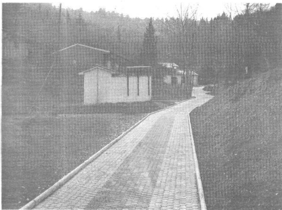
KAJ JE NOVEGA V NAŠEM OBMORSKEM LETOVIŠČU?