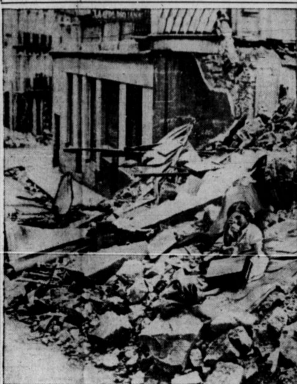
Na sliki je deklica, ki je v sedanji civilni vojni v Španiji izgubila očeta, mater in dom.