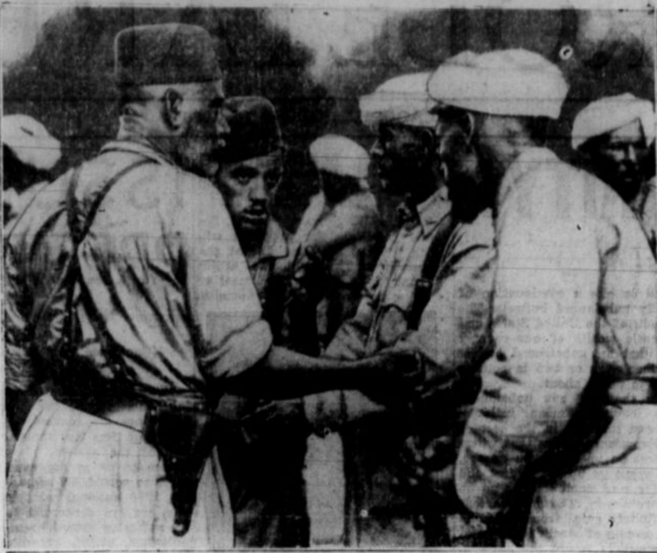
Fašistični general Francisco Franco je v španjski vojni proti ljudski vladi. Muri so mohamskem Moroko mobiliziral tisoče Muror in jih poslal v španjsko vojni proti ljudski vladi. Muri so mohamske vere in zelo bojoviti.