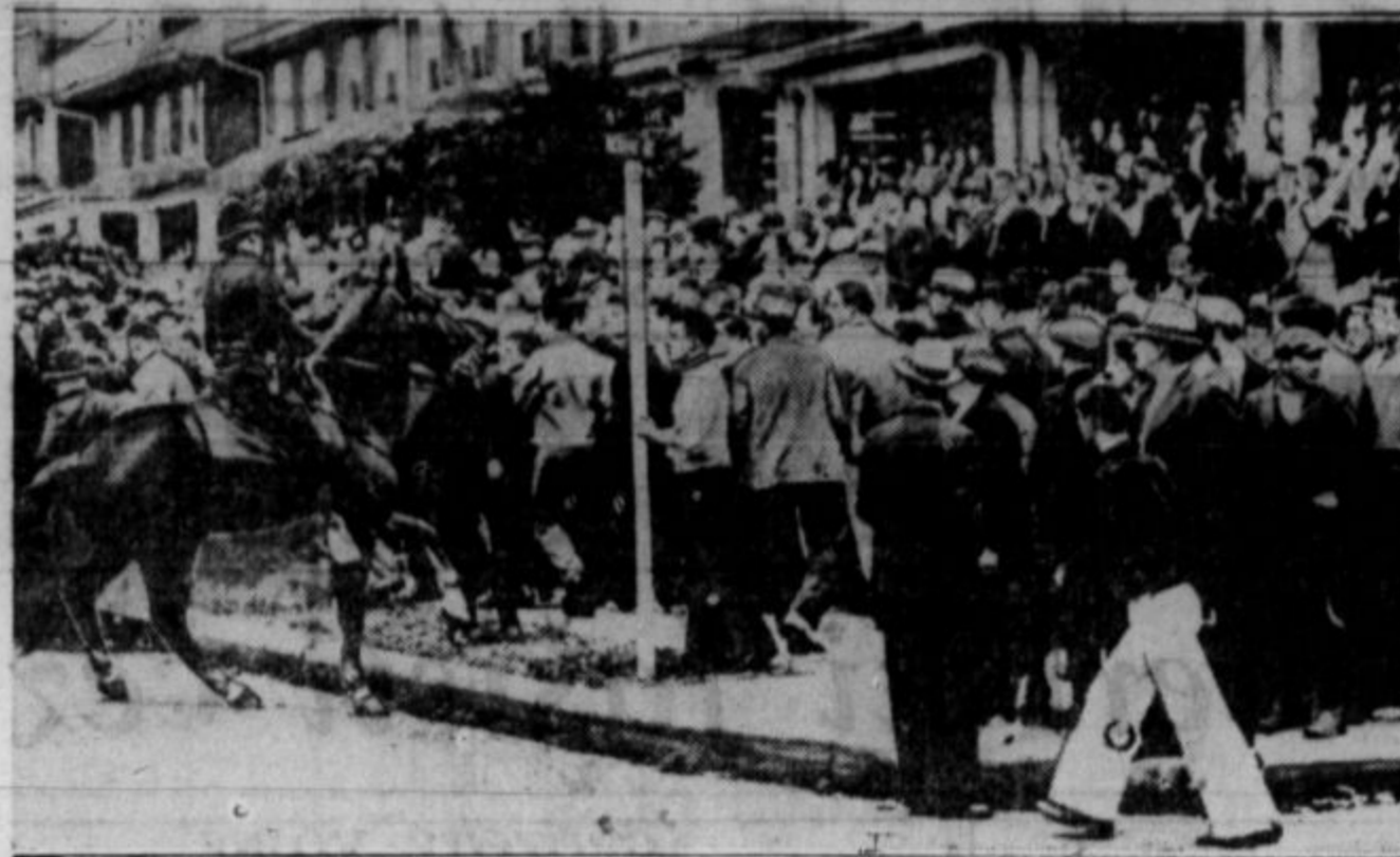
Stavko svojih delavcev skuša Berkshire Knitting kompanija stroti s škebi. Dobil je iz New Yorka in drugih krajev. Ko so delavci demonstrirali pred tovarno proti škebom, jih je napadla državna policija. Okrog petdeset stavkarjev so policaji zbili na tla. Mnogo je bilo aretiranih.