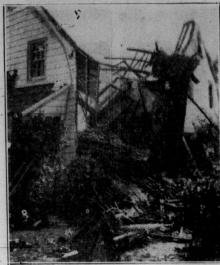
Ostanki liče v Penn-Wynne, Pa., ki jo je uničila eksplozija plina. Neki agent, ki je bil slučajno v hiši, je bil ubit. V hiši je bila velika zbirka starinskih predmetov, cenjena $35.000. Ker je takoj po eksploziji nastal požar, ki je to redko zbirko popolnoma uničil.