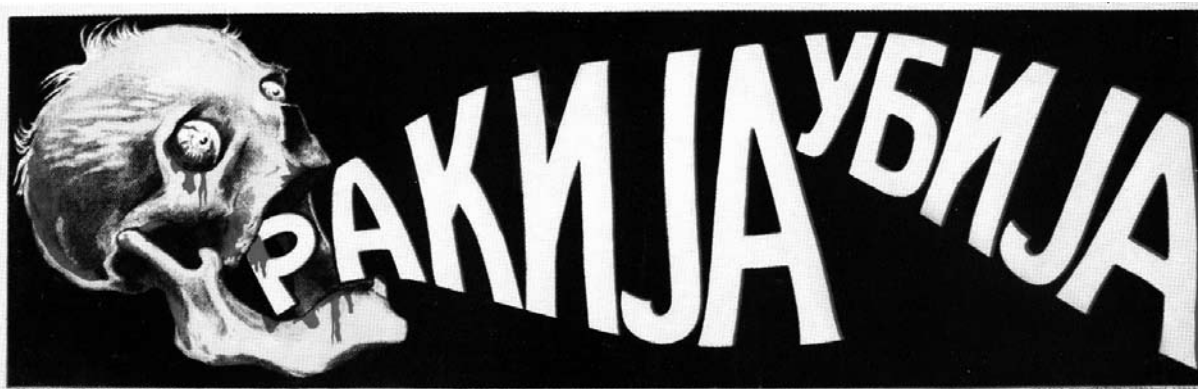
Žganje ubija. (Tisk: Hrvatski štamparski zavod d. d., podružnica Osijek; hrani NUK, objava v: Meta Kordiš, Gospodična, vi ste lepi kot plakat. FF OEiKA, Ljubljana 2005)

a) organiziranih »treznežev« je bilo 7,7 %, vseh skupaj pa 28,4 %