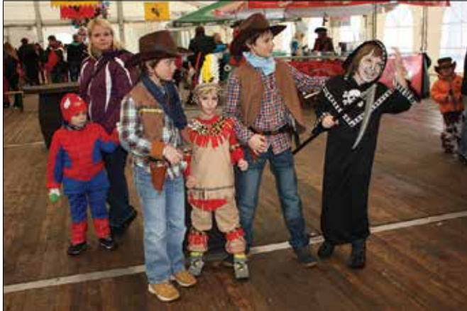
V Mozirju so se družili Indijanci, kavbojci, Spiderman, osebe iz grozljivk in mnogi drugi.

V Mozirju so v organizaciji Pusta Mozirskega maskice in njihove starše zabavale dekleta plesne