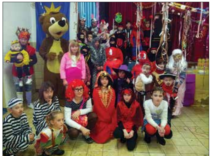
Zimo so v Radmirju preganjali: coprnice, gusarji, princeske, spajdermeni in drugi, ki so celo nedeljsko popolne veselo rajali in se mastili s krofi. Čeprav zime niso uspešno pregnali, je rajanje uspelo. »Maškarce« so obljubile, da drugo leto spet pridejo.