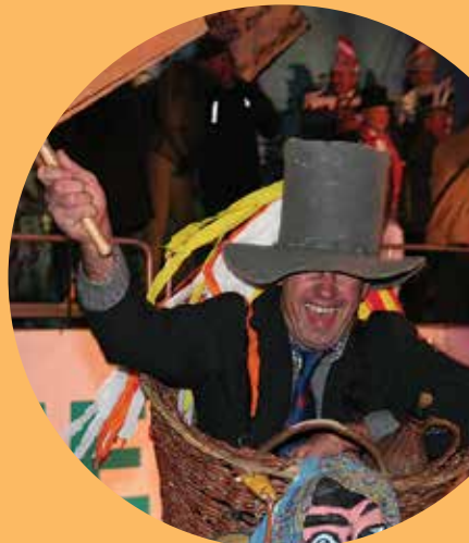
Upamo, da so šoštanjske babe tudi letos v koših srečno dostavile svoje može domov.