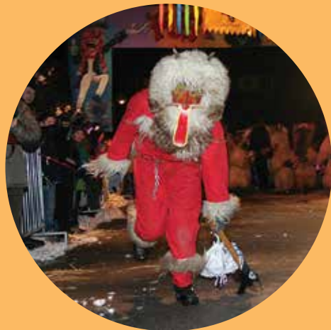
Najbolj znana slovenska pustna maska so koranti, ki s poskakovanjem preganjajo zimo.