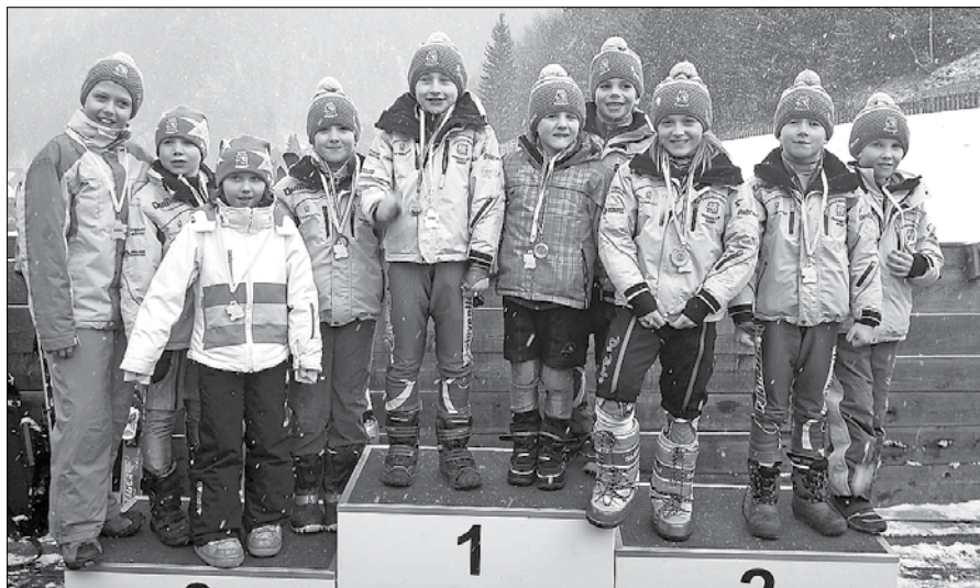
Mlajši cicibani III. selekcije GSK Mozirje na tekmah že dosegajo odlične rezultate.