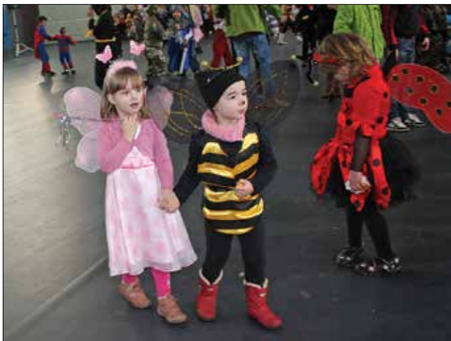
Za žuželkice je v Nazarjah zima že odšla.

skupine Foxy teens in David Grom. Zanimivo žonglersko predstavo sta pripravila brata Malek. Pred zabavnim programom so se otrokom in njihovim staršem predstavili tudi mozirski pustnaki.