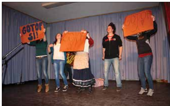
Protestni val je zajel tudi solčavsko prestolnico.

Solčavski vinarji so se tudi tokrat dotaknili kritičnih točk in dogodkov preteklega leta. V hotelu pri Vinarju so reševali zagate z (ne)zna-