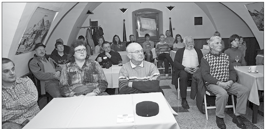
Zbrani so si ogledali dokumentarec o izginjanju čebeljih družin v ZDA.