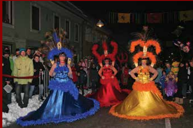
Skupinska maska iz KUD Maska Stojnci z naslovom Fantazija je letošnja zmagovalka ptujskega pustnega karnevala.