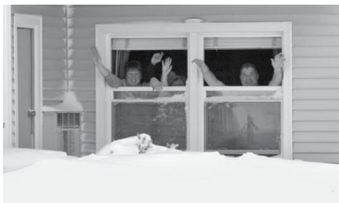
Lep pozdrav iz zasneženih dobav!

Po tem redu bi bil 21. avgust lahko dan za sestop pustne oblasti. Glede tega se vijejo razprave, da bi tega dneva sploh ne smelo biti ali pa bi moral biti čim kasneje v letu.