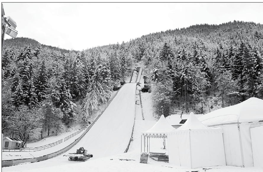
Skakalnica, VIP šotor, šotor za novinarje in ostala infrastruktura, vse je pripravljeno in čaka na veliki dogodek na Ljubnem.

Stadion, tribune in ograje so postavili v začetku tega tedna. V ponedeljek se je še zadnjič na seji sestal tekmovalni odbor, v torek organizacijski komitej. Glavna tiskovna konferenca pred tekmovanji se je v sredo odvijala v ljubljanskem BTC-ju, dan kasneje so ekipe že prišle na prizorišče tekmovanja. Okrog 200 ljudi, med temi 55 tekmovalk iz 15-ih držav bo zapolnilo vse prenočitve-