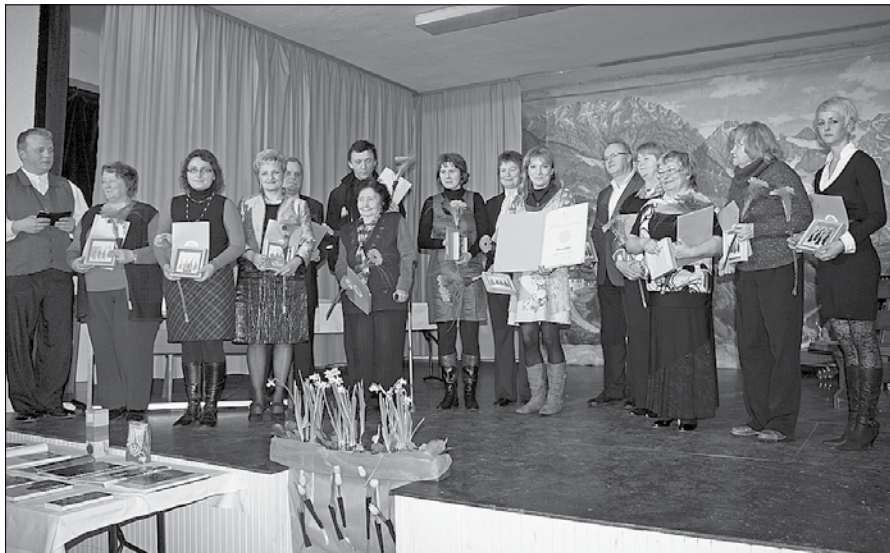
Dobitniki priznanj JSKD OI Mozirje za dosežke na kulturnem področju za leto 2012