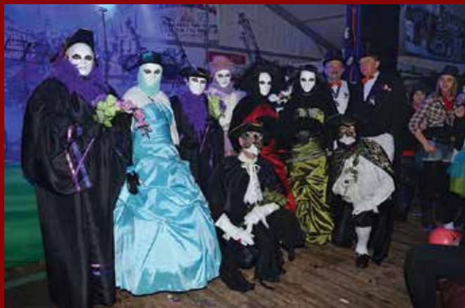
Prvo nagrado na letošnji gala maškaradi so odnesle beneške maske.