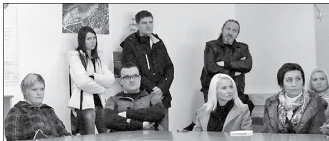
Odziv ljudi, ki si želijo zaposlitve v mednarodnem centru za avtiste, je bil velik.

Trideset ljudi je najprej prisluhnilo mozirskemu županu Ivanu Suhoveršniku, ki je spregovoril o Mozirskih tratih kot priložnosti za