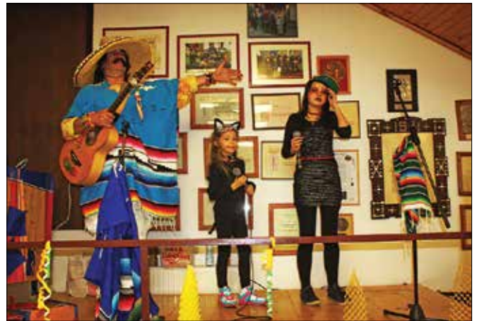
Spidiju so bile pri oblikovanju programa na Rečici ob Savinji v pomoč tudi male maškare.