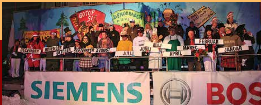
Tudi mozirski pustniki so se lotili izdelave svojega koledarja.