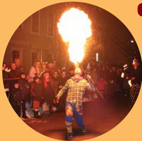
Artisti s Ptuja so ogreli ozračje nad obiskovalci.