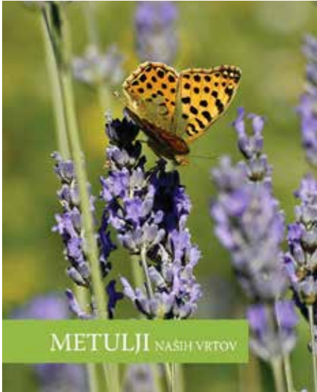
Naslovnica knjižice Metulji naših vrtov .