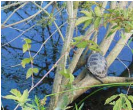
Močvirska sklednica.