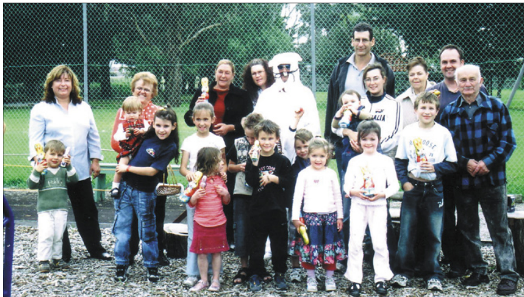
Mladi, navdušeni iskalci čokoladnih zajčkov na veliko noč na Planici.