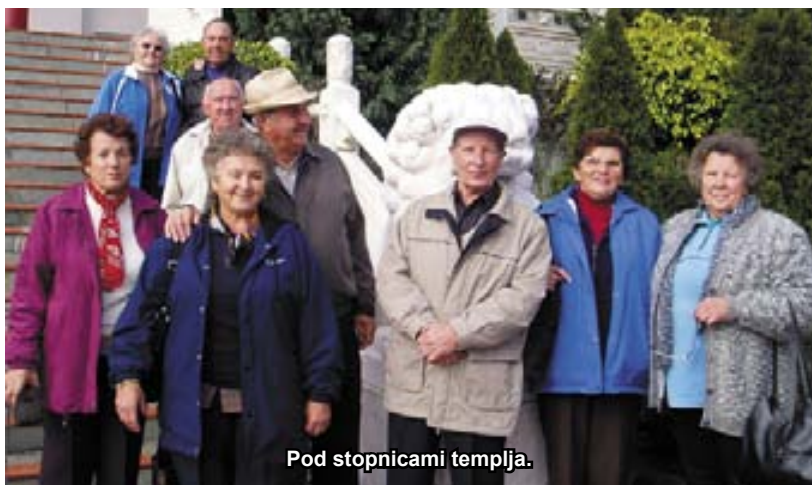
Pod stopnicami templja.

Po dobrem kosilu v klubu v Wollongongu smo obiskali še Kyamo, kjer smo se prerivali z japonskimi turisti pri ogledu slovite luknje v obali, skozi katero se ob vsakem