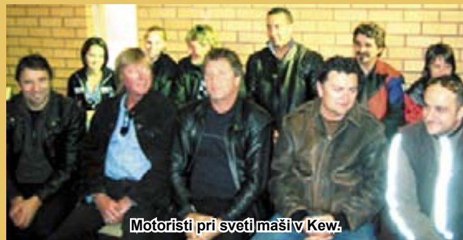
Motoristi pri sveti maši v Kew.