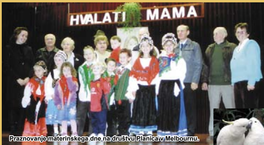
Praznovanje materinskega dne na društvu Planica v Melbournu.