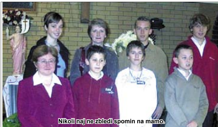
Nikoli naj ne zbledi spomin na mamo.

izseljenskih skupnostih, kjer so mladi predstavili skrivnosti rožnega venca od spočetja do križanja na Kalvariji. Organizatorji se trudijo, da bi s svojo domiselnostjo privabili k sodelovanju čim več vernikov. Vedno več je tudi afriških skupin, ki s svojo kulturo doprinesejo veliko lepega, posebno s svojo pesmijo in plesi, kar je za nas bele nekaj nenavadnega. Letos je prvič v 26-tih letih, odkar sem v Adelaidi, za to priliko nebo malo rosilo. Zaradi rahlega dežja ni bilo pridige. Glasba je bila pa izredno lepa in mladi, ki so peli, posebno duet, smo vsi občudovali. Želel bi, da bi jih kdaj povabili v našo cerkev, da bi pri nas zapeli med mašo... Naša skupnost je bila lepo zastopana, tudi narodne noše so bile tam, vendar so sedaj že kar redkost na procesiji. Včasih je bilo v vsaki izseljenski skupnosti veliko narodnih noš, sedaj smo še mi, Slovenci, pa Hrvatje, Litvanci; največ pa je še vedno Vietnamcev. Verjetno bodo Vietnamci najbolj dolgo držali tradicijo. Hvala vsem, rojakom, ki se leto za letom udeležujete procesije in poskrbite, da ja naša bandera vedno prisotna in vodi našo skupnost. Upajmo, da bo drugo leto vreme bolj naklonjeno.