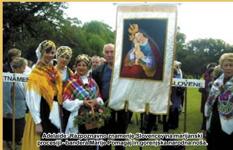
Adelaide: Razpoznavno znamenje Slovencev na marijanski procesiji - bandera Marije Pomagaj in gorenjska narodna noša.