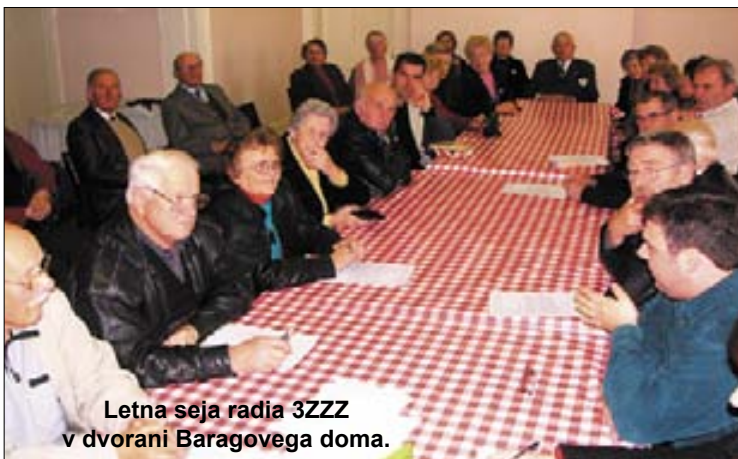
Letna seja radia 3ZZZ v dvorani Baragovega doma.