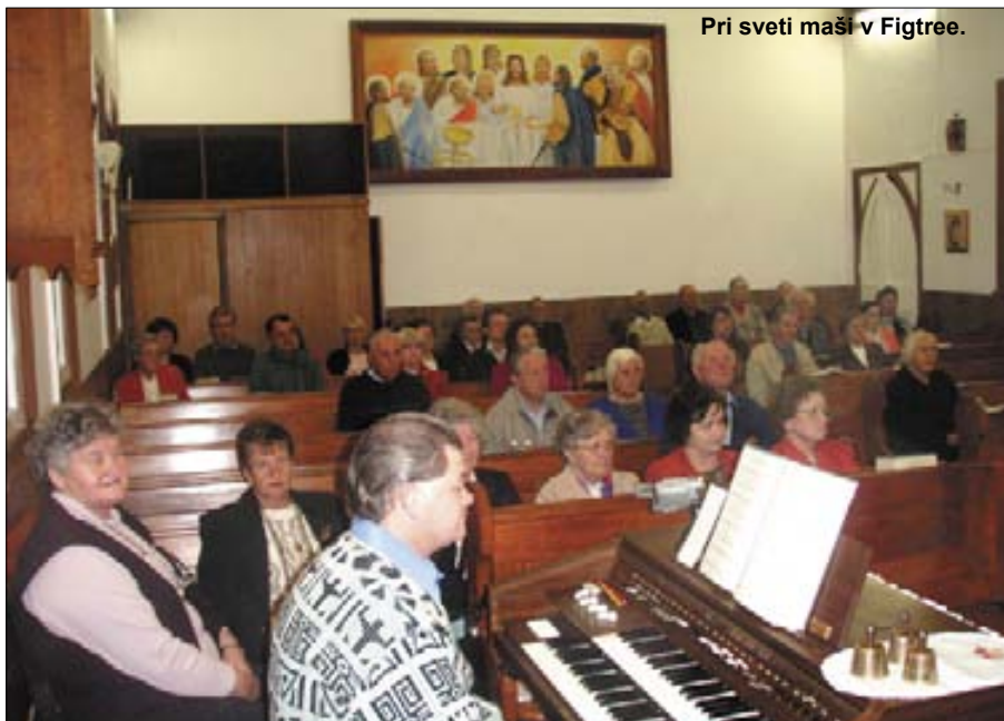
Pri sveti maši v Figtree.

Sv. maše bodo: v soboto, 1.07., ob 7.30 v Surfers Paradise, v nedeljo, 2.07., pa ob 10.30 na Planinki in popoldne ob 5.00 v Buderimu. Maševal bo p. Darko. Rojaki, obvestite se med seboj in obvestite tudi bolne in ostarele, da jih obiščemo!