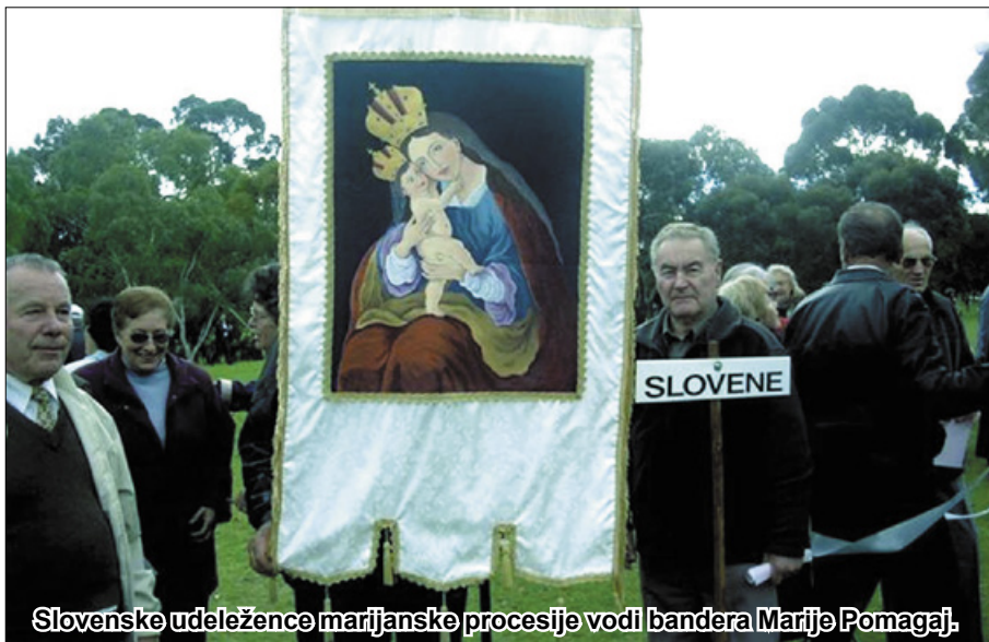
Slovenske udeležence marijanske procesije vodi bandera Marije Pomagaj.

zastopnika. Od zbirnega prostora do oltarja smo med procesijo molili rožni venec v različnih jezikih. Letos je bil poudarek na rožnem vencu. Ob poti, kjer je šla procesija, je bilo sedem malih skupin