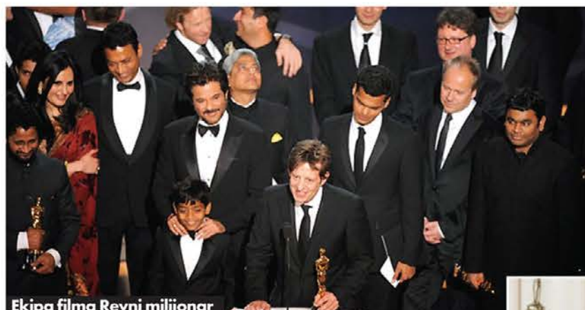
Ekipo filma Revni milijonar

Revnemu milijonarju . Praznih rok sta ostala tudi Brad Pitt, ki je bil nominiran za glavno moško vlogo v filmu o Benjaminu Buttonu, ter Angelina Jolie za glavno žensko vlogo v filmu Zamenjan . Film Milk je pobral oskarja za izvrstni scenarij (Dustin Lance Black), Sean Penn pa je premagal favorita Mickeyja Rourkea in osvojil oskarja za glavno moško vlogo v tem fil-