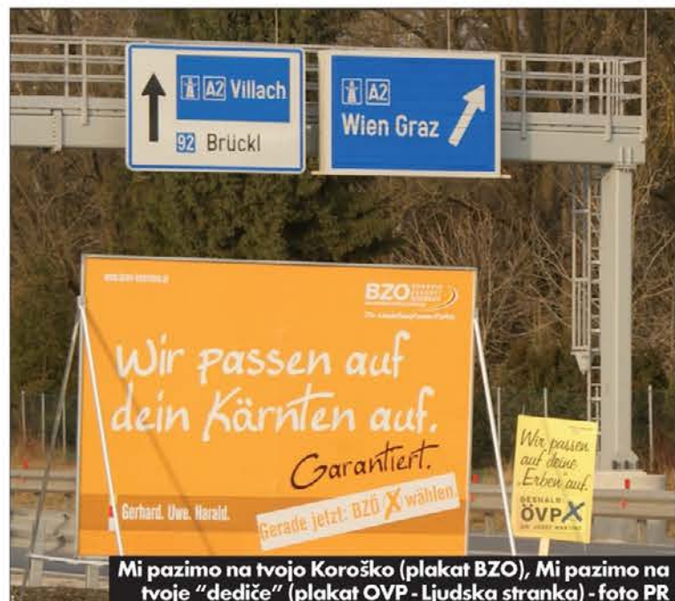
Mi pazimo na tvojo Koroško (plakat BZO), Mi pazimo na tvoje "dediče" (plakat OVP - Ljudska stranka)

novimi strukturami od železniške postaje do pošte, muzejev, sodnije, guvernerske palače, novih dostopov, poletne rezidence v Castelgandolfo. Veliko je bilo novih izvenozemeljskih objektov. Vse to lahko vidimo na bogati razstavi z