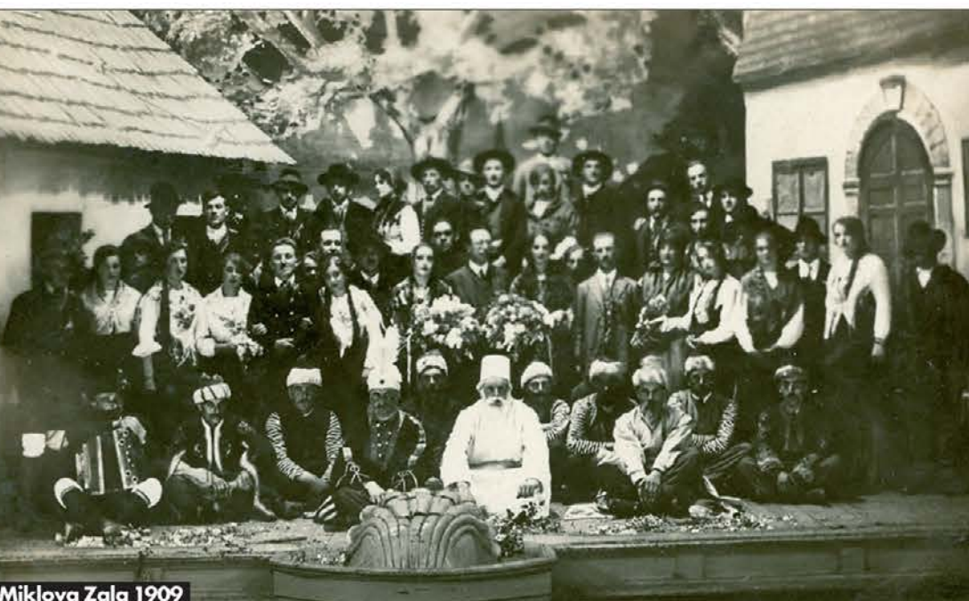
Miklova Zala 1909