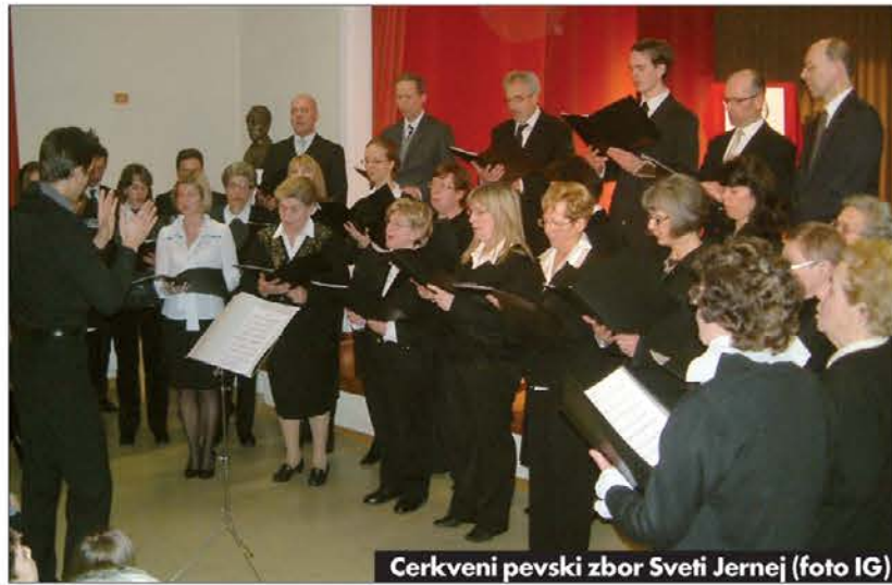
Cerkveni pevski zbor Sveti Jernej