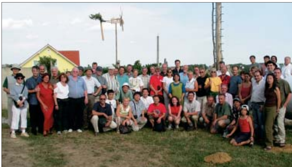
Udeleženci srečanja »Mesta v tranziciji« na ekskurziji v severovzhodni Sloveniji.