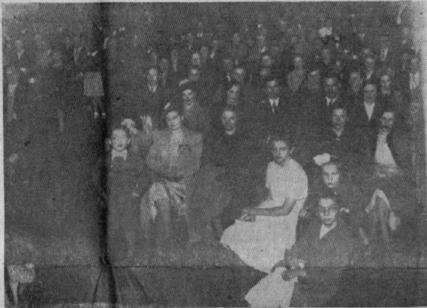
Udeleženci na prireditvi "Slovenskega doma"

V nedelju 29. t. m. se bo v domu že vršila ljudska veselica, ki bo tra-