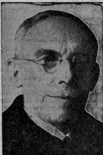
Dr. Vlatko Maček