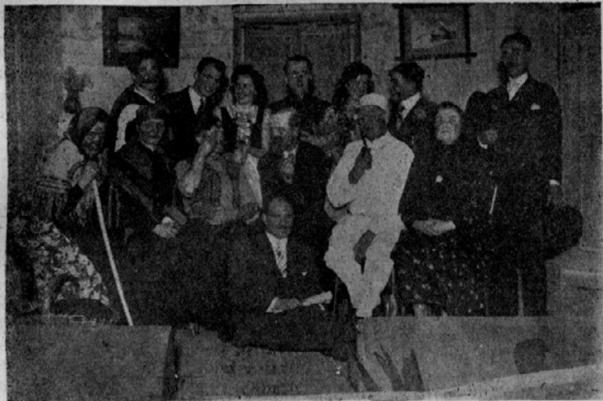
Igralci "Slovenskega doma" v igri "Trije vaški svetniki"

Igra, ki je že sama na sebi zanimiva in živa, so jo igralci še poživeli. Reči se mora, da so se vsi igralci izkazali prave mojstre v igranju. "Slovenski dom" je lahko ponosen, da ima take igralce, saj taki igral-