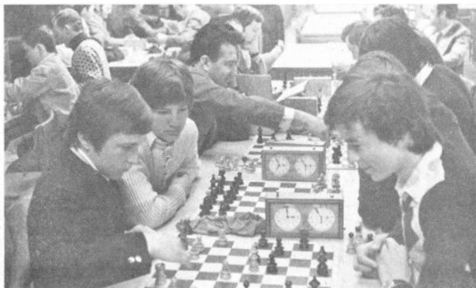
V Velenju je bilo republiško šahovsko prvenstvo

Organizacija turnirja je bila zelo dobra. Pokrovitelj pa je daroval najboljšim ekipam pohvale in praktične nagrade. Vrstni red — člani: 1. Maribor 38,5; 2. Ljubljana 35,5; 3. Celje 34,5; 4. Trbovlje 26,5; 5. Kočevje 25,5; 6.—7. Ptuj in Tezno 24; 8.—9. Jesenice in Murska Sobota 21,5; 10. Zalec 18; 11. Slovenj Gradec; 12. Velenje; 13. Kamnik; 14. Koper; 15. Kranj itd.; mladinci: 1. Ljubljana 77,5; 2. Maribor 75; 3. Zagorje 53,5; 4. Maribor 52; 5. Ptuj 51,5; 6. Murska Sobota 51; 7. Novo mesto 48; 8. Slovenj Gradec 46,5; 9. Jesenice 46; 10. Hrastnik 45 itd.