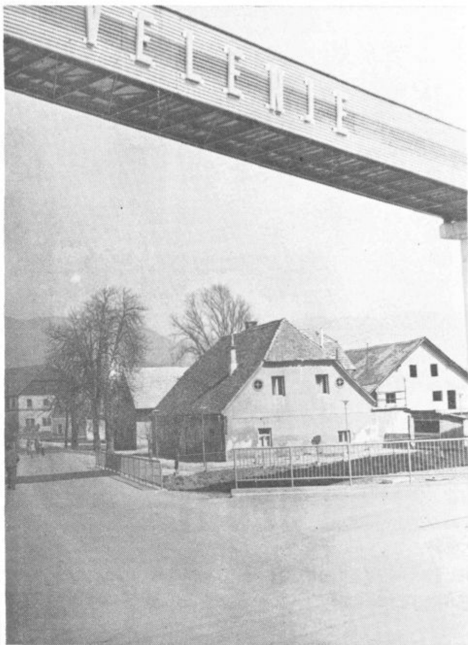
Melanškova gostilna v Pesjem

»Vse to imam za hvaležnost, da sem jo hotela zdraviti. Zdaj se mi je maščevala. Toda, jaz jo bom tožila. To so mi svetovali tudi moj osebni zdravnik in drugi. Baže ne obtožuje samo ta. Tako se potem zgodi, če je človek predober. Zanima me, kje je zdaj to dekle? Ali se je vsaj pozdravilo?«