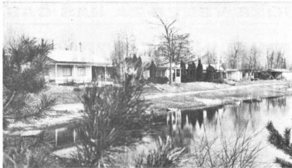
Turistično naselje Sodarica

Preselimo se še malo naprej, v Hlebine, kjer se je rodil in delal Krsto Hegedušić. Vsi poznamo ime umetnika in začetnika slikarske naivnosti pri nas. Tu je delal in še dela Generalić, ki ga je vzel v uk Krsto že kot majhnega dečka. Zato imajo v Hlebinah tudi Hegedušičevo šolo. V tej šoli se zbirajo vsi znani slikarji-naivci, ki tvorijo klub. To so Kovačić, Gaži, Filipović in Večenaj. Združuje jih slikanje in steklo. Kdo ve koliko stekla so že