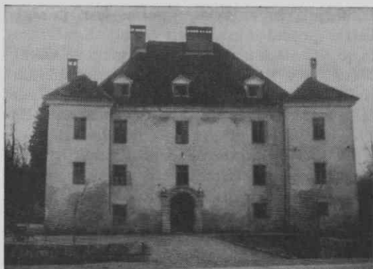
Grad v Gorenjem Logatcu pred obnovo.