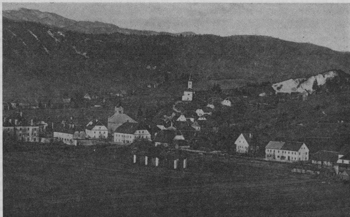
Gorenji Logatec pred prvo svetovno vojno

Seveda pa ni manjkalo tudi bolezní in drugih nesreč. Že 1848, 1859 in zlasti 1866, ko so bile vojne v Italiji, je bilo v Logatcu vedno polno vojakov, ki so skoraj vedno zanesli