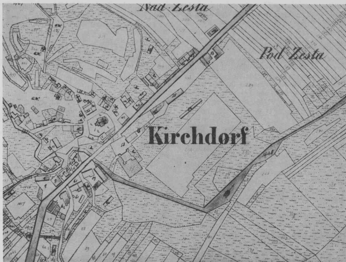
Gorenji Logatec, nekdanja Cerkovska vas (nemško Kirchdorf) po francisc. katastru iz 1823-24 v Arhivu Slovenije

rastlo zlasti po 1876, ko so iz Planine prestavili v Gor. Logatec okraj, sodnijo in davkarijo, se je 1878 ločila šola v Dol. Logatcu, kjer so 1883 odprli novo šolsko poslopje, Gorenji Logatec pa je dobil novo šolo 14. septembra 1884, ki je bila 1888/9 razširjena v trirazrednico.