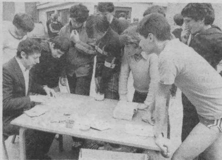
Posvet pred začetkom