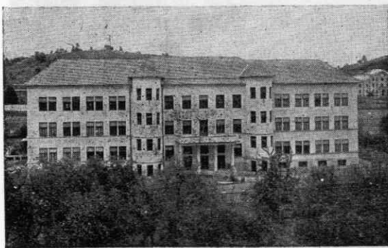
Slika 4. Nova šola v Škofji Loki, zgrajena l. 1932. Do l. 1953 sta bili v njej gimnazija in osnovna šola

V letih 1830 do 1848 je bilo postavljeno novo šolsko poslopje, ki je imelo le eno učilnico. Zaradi pomanjkanja prostorov so 1878 postavili