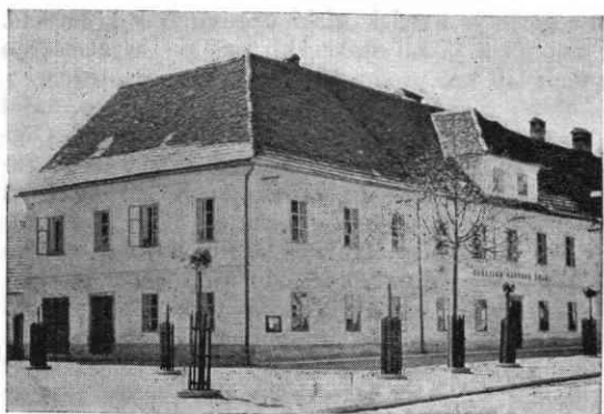
Slika 5. Stara šola v Ribnici na Dolenjskem, zgrajena 1847