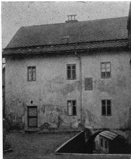
Slika 2. Poslopje stare škofjeloške trivialke iz l. 1627

V kronikah ostalih mariborskih šol so navedeni podatki o ustanovitvi s podatki, ki smo jih