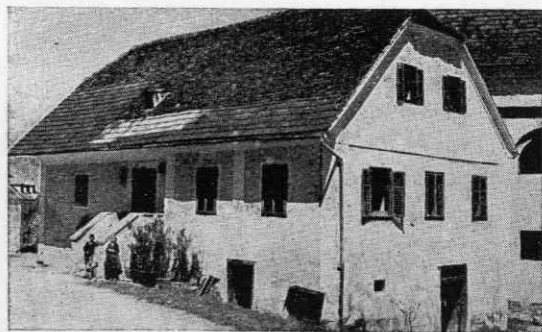
Slika 7. Stara šola v Šentilju v Slov. goricah iz l. 1787. V njej je bil pouk do l. 1869

Ob zaključku naj navedemo, da so za neka-Prvi tak opis sta sestavila učitelja Tomšič in o njihovi ustanovitvi in iz krajevne zgodovine.