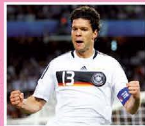
Michael Ballack po zadetku proti Portugalcem

Do konca redakcije se polfinalne tekme še niso odigrale. V tokratni številki zato nekoliko analiziramo polfinalistke. Presenečenjema Rusiji in Turčiji smo posvetili glavni članek. Nemčija in Španija sta stari znanci svetovne nogometne elite. V četverboju, ki vodi proti evropskemu vrhu, sta tudi nesporna favorita. Prav letošnje evropsko prvenstvo pa nas je ponovno naučilo, da so favoriti eno, končni zmagovalci pa drugo. Nizozemci, nogometni bratrance Nemcev, so po treh izvrstnih predstavah v predtekmovanju odigrali zelo povprečno proti poskočnim Rusom in zasluzeno izpadli. Tudi evropski Brazilci, Portugalci, so kljub prvi nogometni svetovni zvezdi, Cristiano Ronaldo, izpadli že v četrtfinalu, ko so se morali soočiti s togo, a zelo konkretno in racionalno nemško ekipo. Velike pomanjkljivosti so pokazali predvsem v obrambi. Portugalci bi s pozornejšo postavitvijo v obrambi zlahka preprečili drugi Klosejev in treji Ballackov gol. Španci so doslej pokazali zelo dober nogomet: zmago proti Italiji, ki je sicer prišla šele po 11-metrovkah, so zasluzili. Bili so preprosto boljši tekmeč, ki ima v vrhunski napadalni dvojici Torres - Villa samo izreden zaključek dobro dodelane ekipe igre.