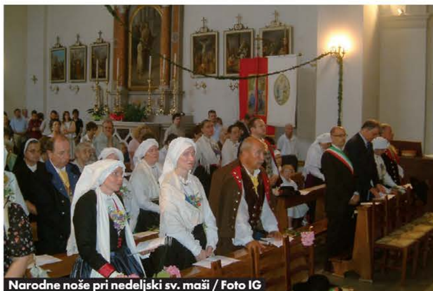
Narodne noše pri nedeljski sv. maši