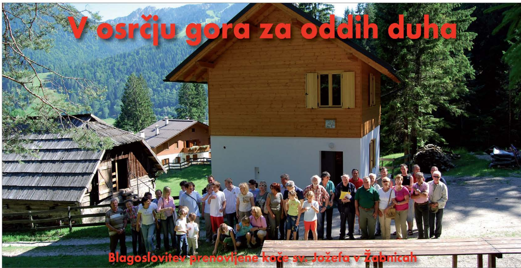
Blagoslovitev prenovljene kočice sv. Jožefa v Žabnicah