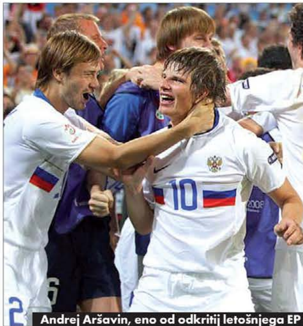
Andrej Aršavin, eno od odkritij letošnjega EP

tašev spremenil v pravo ekipo. Na čelu nove ruske generacije je Andrej Aršavin, sedemindvajsetletna polšpica. Gre za zvezdo sanktpeterburškega Zenita, ki je