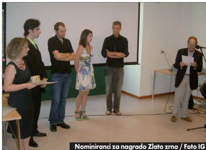
Nominiranci za nagrado Zlato zrno