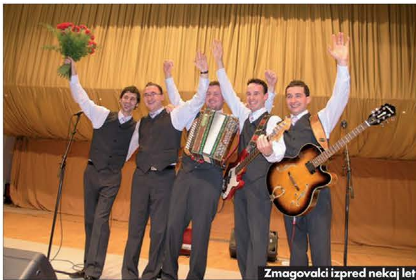
Zmagovalci izpred nekaj let

nikom gre seveda vsa čast in pohvala za drzen pričetek take manifestacije, mi mladi pa smo dobesedno ponosni, da lahko danes pri Festivalu sodelujemo, ga dograjujemo in tako nadaljujemo že ustaljeno tradicijo.