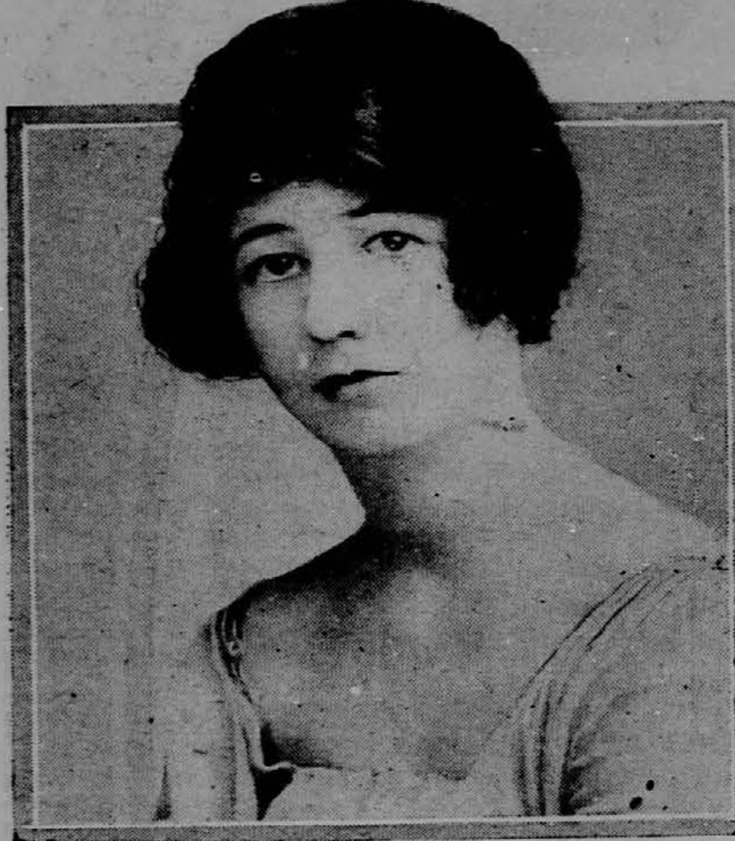
Slika nam predstavlja Lady Phillis King, hčerko Lady Lovelace, o kateri krožijo govorice, da je nevesta angleškega prestolonaslednika.