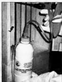
Avtomatska škropilnica za zdravljenje čebel z oksalno kislino

DELOVNI ČAS: pon.–pet. od 8.–12. in od 15.–18. ure