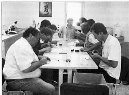
Seminar za lastno vzrejo čebeljih matic v Izobraževalno-vzrejnem centru na Zelenici