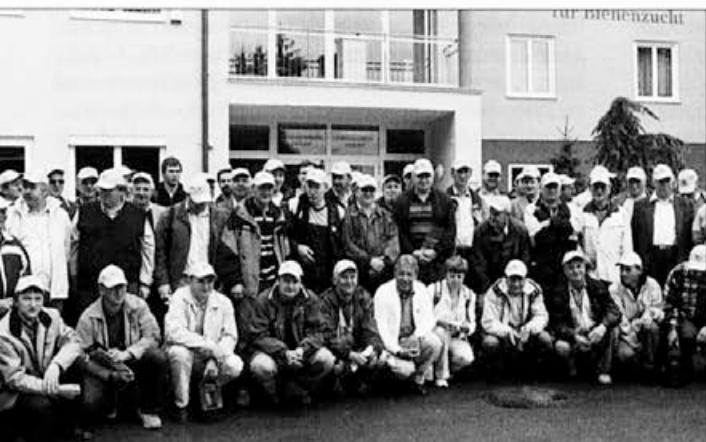
Bodoči čebelarji na obisku v čebelarji šoli v Gradcu.

dni. Družinam, ki jih nismo prepeljali na hojo, dodamo v predelavo večjo količino hrane. Tako družine, ki so ostale doma, poleg svoje zaloge predelajo še za eno naklado zimske hrane. Ta hrana je kakovostnejša, ker je bila počasi predelana. Ne smemo pa pozabiti in dodati dveh satov s cvetnim prahom, saj bosta ta sata imela odločilno vlogo pri spomladanskem razvoju. Te družine so imele ves vroči avgust stalen dotok hrane, zato ni bilo potrebno čezmerno vnašanje in iskanje vode za vzdrževanje ugodne klime v panju. Čebele veliko teže poleti prenašajo vročino kot pozimi se tako hud mraz. Zato je treba stojišče poiskati na takem mestu, da je v bližini stalen vir tekoče vode. Če ima panj preveč naklad z zimsko hrano, čebele z begalnico odstranim iz njih, tako da s tem v družinah ne povzročim prevelikega razburjenja in posledično celo ropa. Naklade nato pozno zvečer dodam panjem na stojišču, na katerega sem prepeljal čebele s hojave paše. Potem jih po zgoraj omenjenem postopku dokrmim z 10 litri sladkorne raztopine hkrati. V to raztopino lahko dodamo tudi nekaj rmana ali pelina, saj to blagodejno vpliva na prebavo