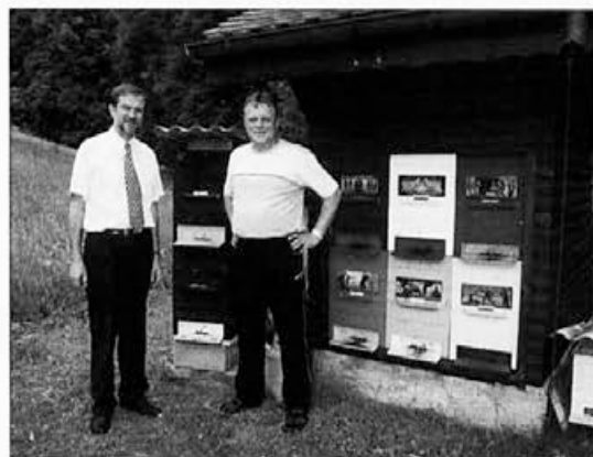
G. Lojze Peterle na obisku v Zgornji Kungoti.