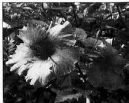
Roza cvetoči hibiskus