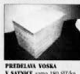
PREDELAVA VOSKA V SATNICE samo 180 SIT/kg