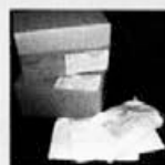
KAKOVOSTNE BELJAKOVINSKE POGAČE V OBLIKI PASTE. IZDELANE SO PO POSEBNEM POSTOPKU IN SE NE STRDIJO.