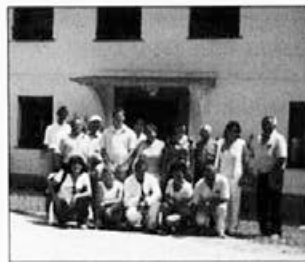
Udeleženci praktičnega usposabljanja na Prevaljah.

Po programu letnega usposabljanja čebelarjev v letu 2005/2006 je to potekalo v organizaciji ČZS na