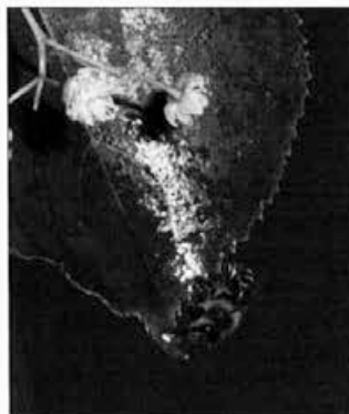
Z listov lipe in hrasta je mana dobese-dno kapljala na tla.