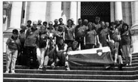
Skupina semiskih čebelarjev pred katedralo sv. Urša v Solothurnu.