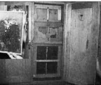
Tradicionalni švicarski panj, z zadnje strani po višini razdeljen v tri etaje. Levo je plodiščni sat.