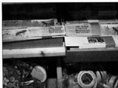
Na policah čebelarje trgovine so med drugim na voljo različne etikete in barviti pokrovi za kozarce, vse prirejeno za individualno prodajo.