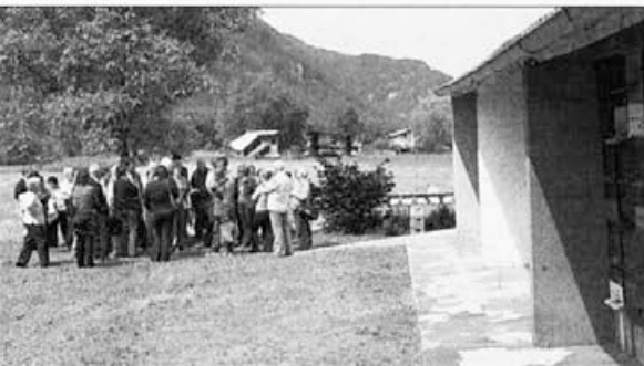
Na čebelnjaku v Sožidu.

Zapis je pripravil po čebelarskem stažu najmlajši član Čebelarškega društva "Henrik Peternel" iz Celja.