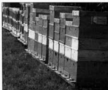
Stojišča nakladnih panjev na kostonju.

Če so bile čebele na pozni gozdni paši na hoji, moramo družinam nameniti več pozornosti. Najprej moramo iz plodišča odstraniti ves manovec, kajti v nasprotnem se ne bomo mogli izogniti nosemi. Manovec je zelo težak za prebavo čebel, zato ga je moramo izločiti. Sate, na katerih so še zalega in veliki venci manovca, premestimo nad podnico, to je v spodnjo naklodo, v kateri jih čebele očistijo, med pa prenesejo in pomešajo z dodano zimsko hrano. Pri pripravi krme moramo paziti, da ta ne bo preveč redka, saj bi družina za predelavo v primerno zalogo hrane potrebovala še več časa. Sam za ta namen uporabim zelo gosto raztopino sladkorja, to je raztopino v razmerju 3 : 1. Da si delo olajšam, sladkor najprej zmeljem, tako da ni potrebno dolgotrajno mešanje. Ker je treba te družine hitro nakrmiti, za to ne uporabim kapilarnih pitalnikov kakor poleti, temveč v panj postavim vedro brez pokrova, vanj pa natresem plutovinaste zamaške, ki preprečujejo, da bi se čebele utapljale v sladkorni raztopini. Krmiljenje ponovim trikrat v presledku 5