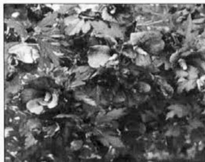
Modro cvetoči hibiskus