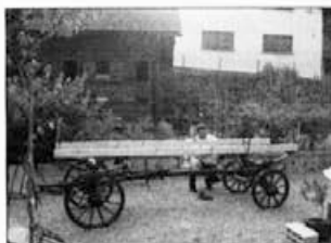
Priprava voza za razstavo.