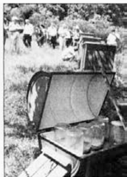
Napajalnik z vodo za čebele.

je iz avtobusa razkazoval Budimpešto in nam povedal nekaj osnovnih podatkov o madžarskem čebelarstvu. Madžarska je upravno razdeljena na 19 pokrajin in Budimpešto. V vsaki pokrajini in v Budimpešti je zaposlen svetovalec za čebelarstvo, skupaj jih je torej 20, ki so plačani s sredstvi Evropske unije. Na Madžarskem je 15.000 čebelarjev, ki oskrbujejo 900.000 čebeljih družin, po ocenah pa naj bi pridelali približno 20.000 ton medu. V njihovih panjih so satniki visoki 42 cm, v ležečih panjih je satnik visok 36 cm, v nakladnih panjih pa 28 ali 18 cm. Največ pridelajo akacijevga medu. Letos je bila bera na akaciji slaba, pozneje pa je medilo dobro. Prizadevajo si, da bi leta 2013 znova organizirali Apimondio. V Budimpešti so jo pripravili že leta 1983, ko so za geslo izbrali: "30 let v Evropi".