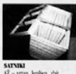
SATNIKI AŽ – vrtan, lepšen, ribi LR – standard LR 2/3