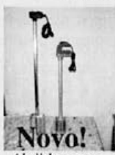
Novo! Akcijna cena – grelci za med 39.990 SIT

PANJI SO IZDELANI NATANČNO IN KAKOVOSTNO.