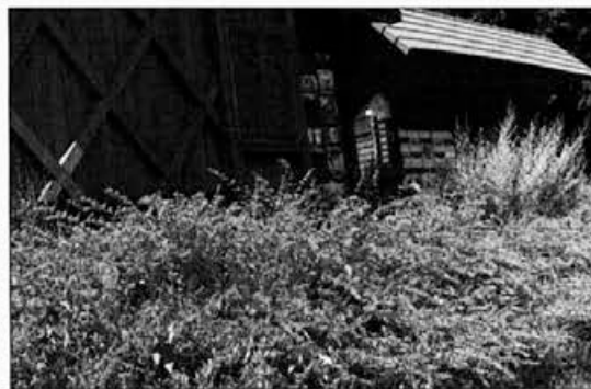
Na sliki je navadna mačja meta pred društvenim čebelnjakom na Brdu pri Lukovici

Zanimivosti – Mačja meta je bila zelo cenjeno zdravilno zelišče, njena uporaba je bila znana že v rimskih časih. Velik pomen je imela tudi v srednjeveškem zdravilstvu, o tem pa pričajo številni stari zapisi. Eterično olje mačje mete vsebuje snovi, ki privabljajo mačke. Od tod tudi ljudsko ime za rastlino.