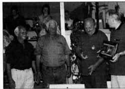
Predstavnikom čebelarjev gostiteljev smo se za požitvalnost in trud zahvalili s priložnostnimi darili.