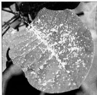
List ruja, na katerem je mana v obliki sladkornih zrn.