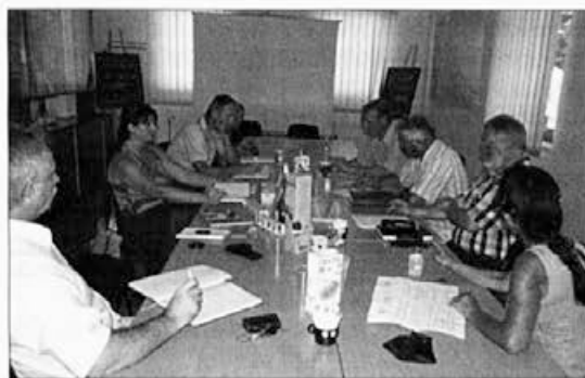
Člani komisije za spominke pri turistični zvezi Slovenije.

Že zdaj vabim vse, ki imajo kaj pokazati, da se prijavijo in udeležijo posvetovanja, bodisi kot razstavljalci ali z 10-minutno predstavitevijo v obliki predavanja. Prijave pošljite na tajništvo ČZS s pripisom "Za posvetovanje o čebelarskem turizmu".