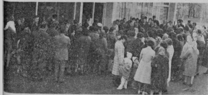
Ob otvoritvi nove samopostrežne trgovine v Slovenskih Konjicah