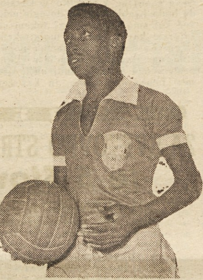
Po sporočilih brazilskih časopi- sov je najmlajši brazilski nogo- metni reprezentant Pele dobil nič manj kot 500 ženitnih ponudb