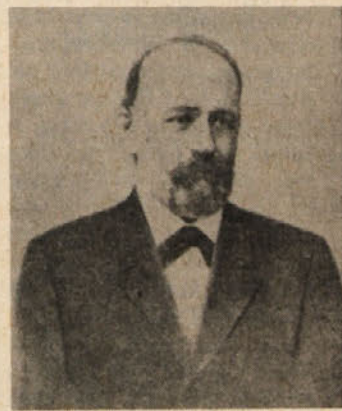
(plemič, dv. svetnik, dr. prof. akademik itd.) Jožef Stefan

Slovenija ga je priznala in po njem poimenovala vodilni znanstveni inštitut, na slovenskih bankovcih pa ga poleg Primoža Trubarja, Franceta Prešerna, Jožeta Plečnika ali Jurija Vege ni. Zakaj? Kljub temu, da je edini Slovenec, ki je doslej odkril kak fizični naravni zakon, je komajda usidran v naši zgodovinski, kulturni in narodni zavesti. Poenostavljeno bi se usodo priznavanja in spominjanja Jožefa Stefana mogli razložiti takole: Stefanov rojstni kraj je po razpadu Avstro-Ogrske ostal v Avstriji, tu pa je kot Slovenec moral biti pozabljen. Še posebej na Koroškem! Medtem ko ima v Celovcu vsak mali nemški ali pronemški umetnik ali znanstvenik, pa tudi marsikateri sporni politik(ant), „svojo“ ulico, Stefanove ni zaslediti. Mlada slovenska država se je s Koroško opekla že ob upodobitvi knežjega kamna na začasnih denarnih bonih in si zato zaradi „dobrososedskih odnosov“ podobe Jožefa Stefana na tolarških bankovcih ne more privoščiti. Slovenska družba, tista v Sloveniji in ta na Koroškem, pa je že tako vedno bolj slavila kulturnike in raznorazne politike.