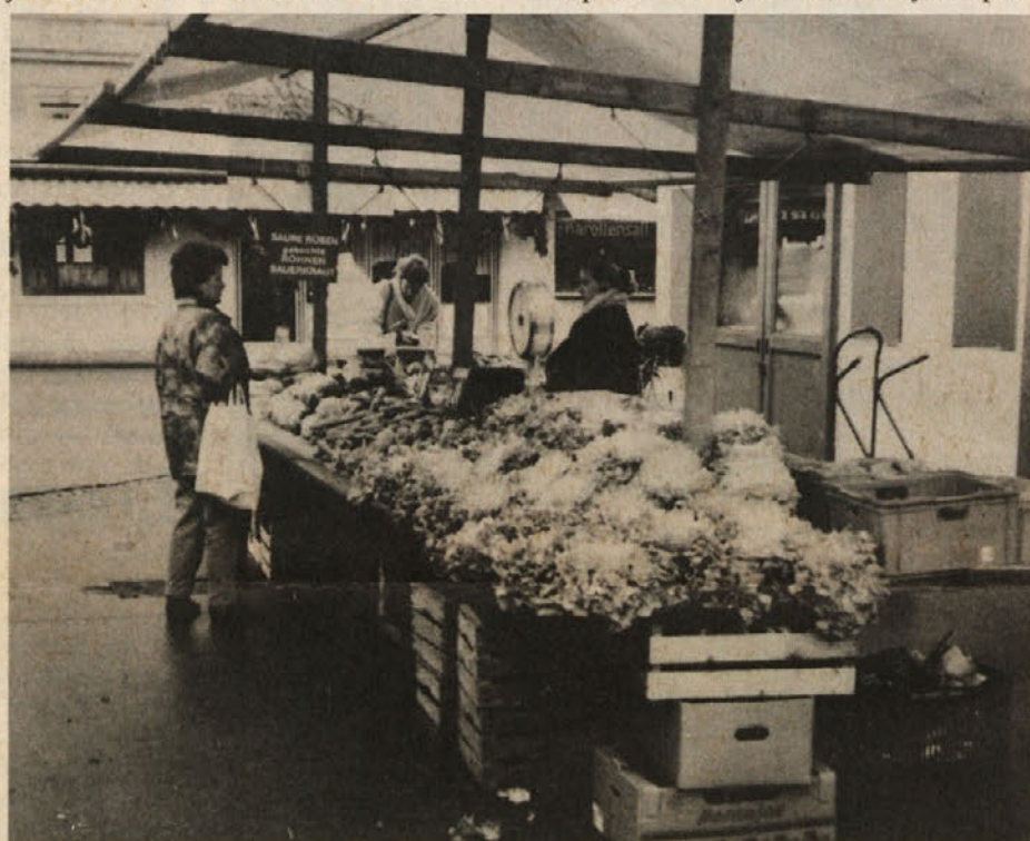
Kmečke pridelke je treba tudi tržiti

Najbolj pa bo sodobno kmetovanje ovirala uredba o višini nitrata v talni vodi. Po prvem juliju 93 v litru vode ne sme biti več ko 30 mg nitrata. Leta 99 se bo ta količina znižala na 18 mg. Po mnenju strokovnjakov bo to slovo od zdajšnje obdelave tal. Da bo morda biološko kmetovanje rešitev za kmetijstvo, je iluzija. Zato sta Kmečka izobraževalna skupnost in Strojni krožek Podjuna spro-