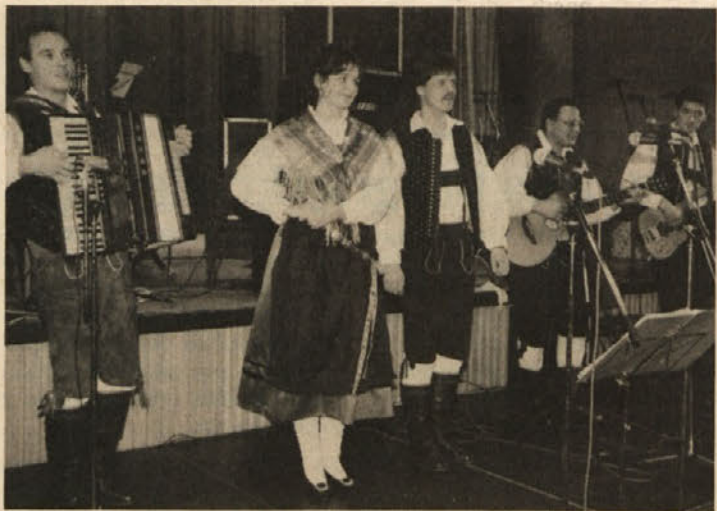
S.W. Poskočne viže je igral ansambel Rubin