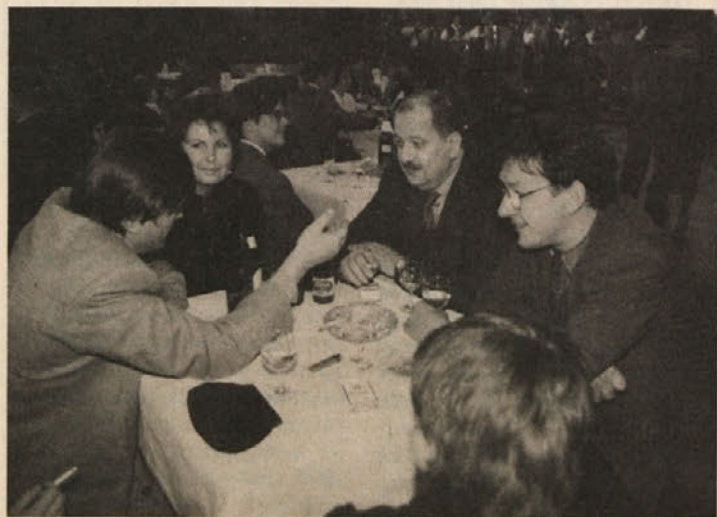
Tudi funkcionarjem je bilo prijetno