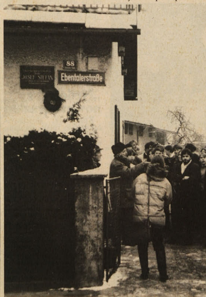
Je bila priložnostna proslava ob stoletnici šele začetek?

nekaj dnevi so razglasili svojo Srbsko vardarsko republiko. Makedonske oblasti sicer niso reagirale, vendar med prebivalstvom in v tamkajšnjih političnih krogih vlada velika zaskrbljenost. Vsa prizadevanja za mednarodno priznanje Makedonije zaustavi Grčija, Srbija pa ima trajne ozemeljske apetite in Makedonijo smatra za svoje ozemlje.