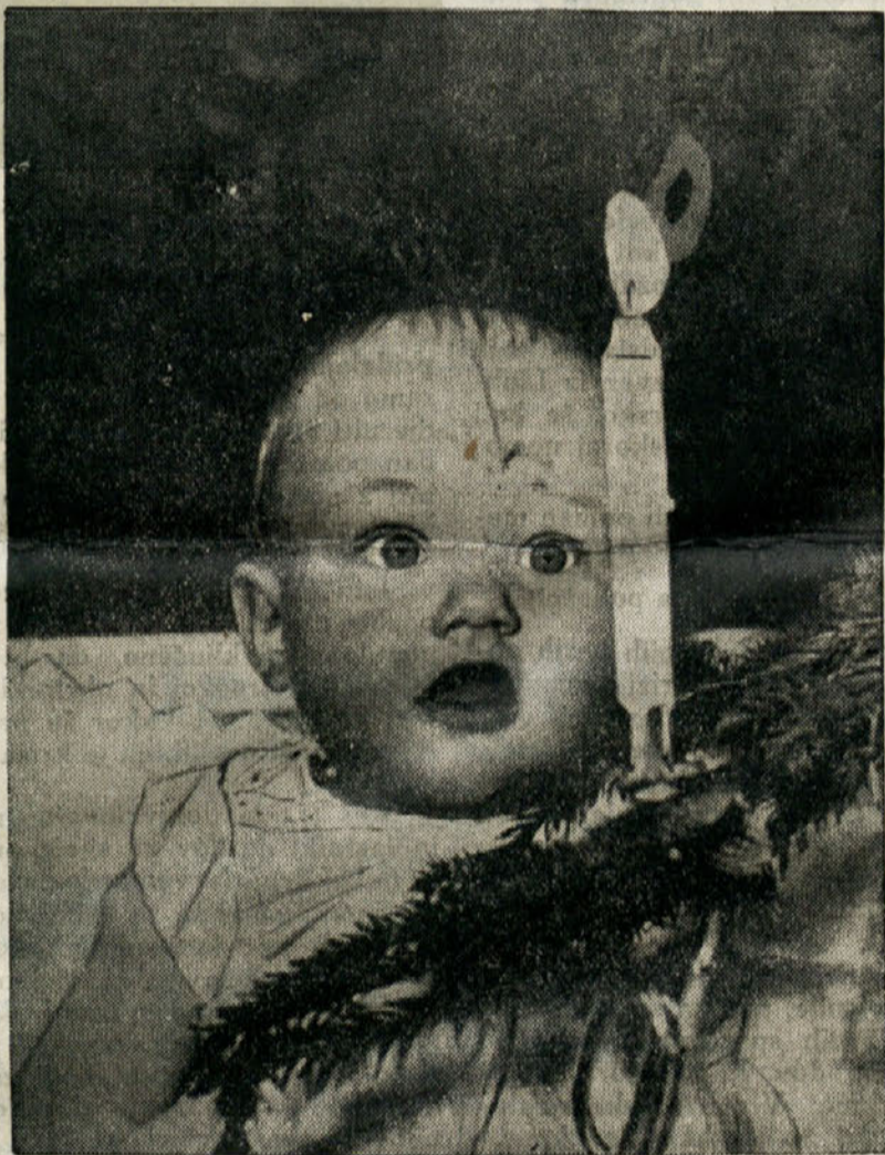
Poglejte, čudo se godi — kaj more nek' to biti?

V Moskvi se dogajajo čudne stvari: na Lubijanki, česti, ki se je ogiblje vsak pošteni človek s strahom v srcu, je zgorelo celo poslopje »čeke« (G. P. U.), zažgali so uradniki, ki jih je zasledoval generalni državni pravdnik zaradi raznih zlorab, da sovietske oblasti ne bi našle kupov kompromitirajočih aktov. Zdi se, da je politični sistem zašel v SSSR v globoko krizo. Litvinov sicer zanje zunanje-politične uspehe, toda notranjepolitično Sovjetska Rusija zdaleka ni tako konsolidirana, da bi utegnila odoleti kakršnemu koli pritisku. Ljudske mase so v