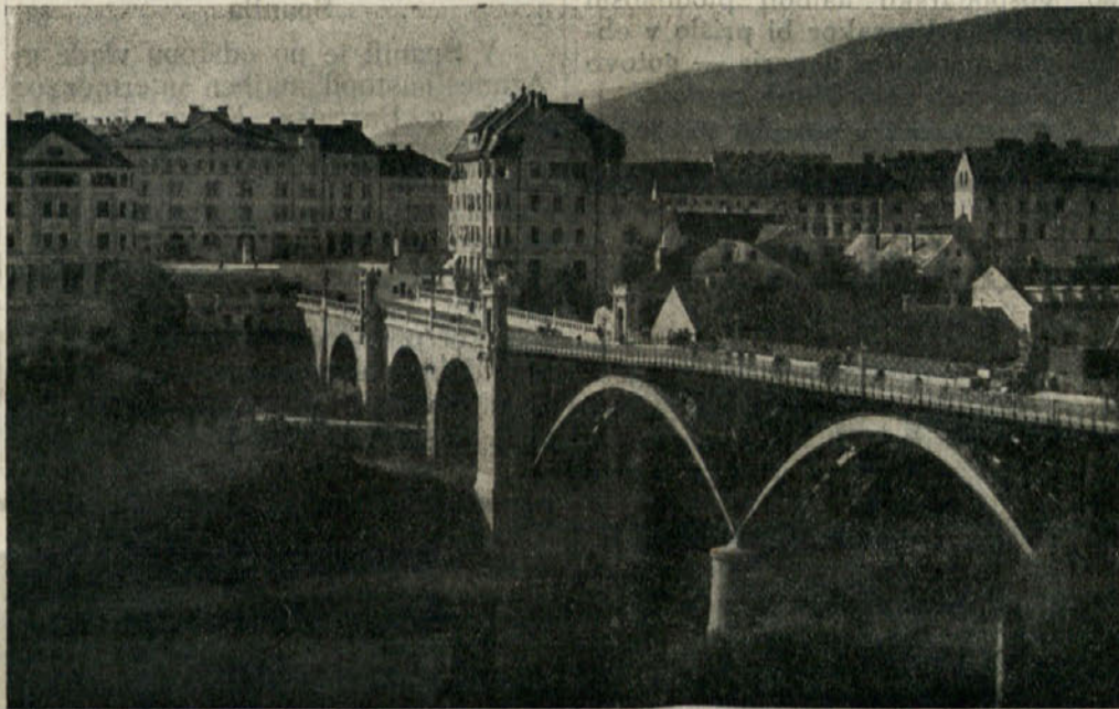
Maribor — pogled na državni most

Cene kmečkih pridelkov vseh vrst se niso dvignile, pač pa so vsled raznih valutarnih sprememb posločile cene proizvodov, ki jih mora kupovati tudi kmet. V mariborskem zaledju je padel življenski stalež kmeta že skoraj na stopnjo, kakor je živel pred 50 leti. V nekaterih krajih se ne morejo več posluževati ne potrošnejske